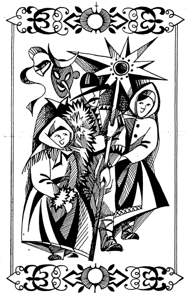
Різдяна ілюстрація роботи Е. Слуцької.

що в металі, але не завжди маю до того нагоду.