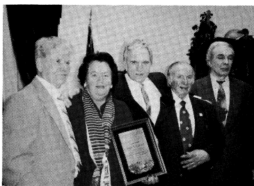
Дж. Трафікант (посередні) з членами української групи (зліва): М. Базилюк, Б. Ольшанська, Дж. Бреннар і М. Балац.

В своєму бюрі конгресмен Трафікант пояснив українській делегации, що для того, щоб його резолюція і законпроект переїшли через обидві палати Конгресу, буде потрібно сильної підтримки від громади. Він дуже наполегливо заохочував всіх об'єднатися у кріпку східноєвропейську коаліцію, в якій звернувши увагу на другорядне трактування американським Урядом натуралізованим громадянам ЗСА, протестувати проти такого трактування і