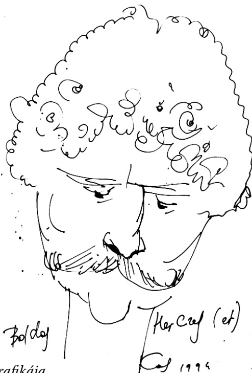
Pieronymus Kosch grafikája

Elhangzott Egerben 2013. április 29-én a Forrás Galériában a „Herczegek” kiállítás megnyitóján.