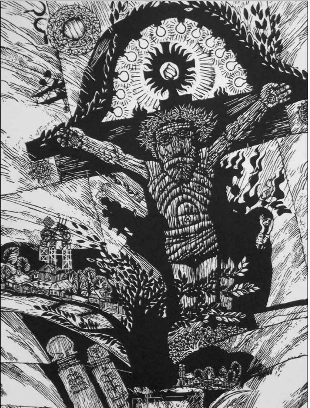
A lapban szereplő grafikák Herczeg István munkái.