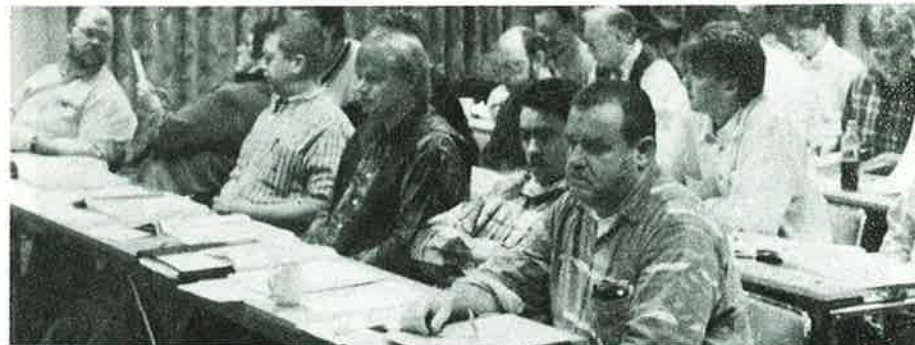
Litt stille ettertanke under budsjettdebatten