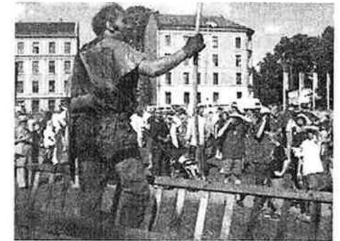
Lederen for Langbuelaget holdt foredrag fra Høyvogna ved Clementskirken.