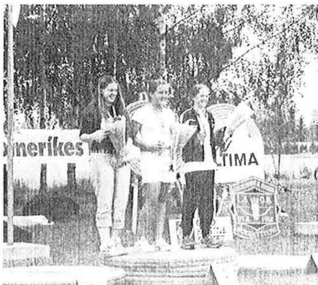
Glade jenter på seierspallen etter et vel avviklet NM.