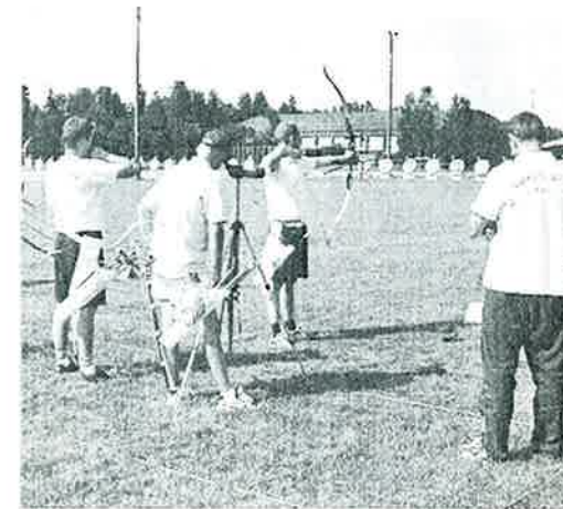
Fredrikstad BS - helt suverene i lag recurve

Så var det finale mellom Fredrikstad og Gauldalspil'n. Dette ble en meget spennende match hvor Fredrikstad til slutt dro i havn en knapp seier (246-244). I recurveklassen var ikke matchene fullt så jevne. Fredrikstad slo Stavanger i semifinalen med 216 mot 192 poeng og Klepp slo Larvik med 206 mot 188 poeng.