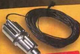
čerpadlo RUCHE 1NG 15m kabel, dopr. výška 40m 2.160.- 1.899.-