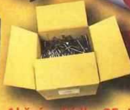
hřebíky stavební velikost 63 - 150 baleno po 5kg 26.-/kg