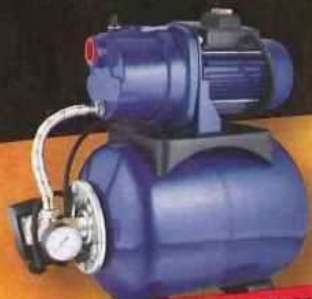
domácí vodárna 800W sací hloubka 8m, zásobník 20l 2.240.- 2.640.-

pracovní doba: Po - Pá: 7:30 - 16:00 • So: 8:00 - 11:00