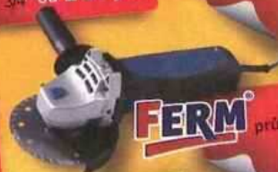
úhlová bruska průměr 125 mm, 950 W 949.- 682.-