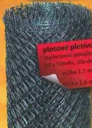
plotové pletivo čtyřhranné potažené PVC 50 x 50mm, síla drátu 2,5 mm výška 1,5 m 67.-/m výška 1,6 m 71.-/m