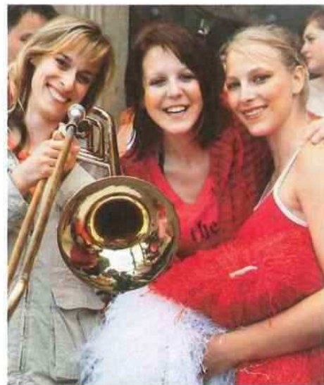
(Dechová hudba neláká pouze seniory!)

Partnery letošního ročníku jsou Olomoucký kraj, Město Konice, Město Litovel, Clarina music – prodejna hudebnin, SKANSKA a.s., SULKO, A.S.A. odpady Litovel s.r.o., PRECIOSA a.s., STAMO, ZOD Ludmírov, Otakar Svoboda, Služby města Konice. O občerstvení se tradičně stará Pivovar Litovel.