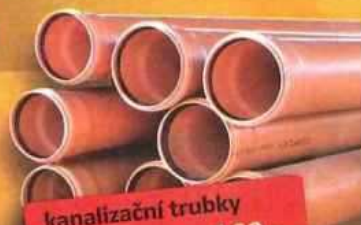
kanalizační trubky průměr: 110 / 2m 169.- 110 / 3m 240.- 110 / 5m 389.- 125 / 2m 189.- 125 / 3m 289.- 125 / 5m 457.-