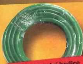
české zahradní hadice 1/2" od 11,50.-/m 3/4" od 19.-/m