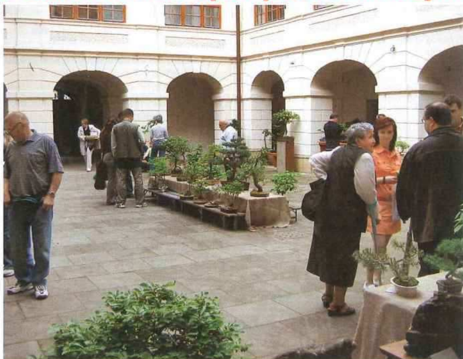
(výstava bonsaji je rok od roku u návštěvníků i vystavujících oblíbenější)