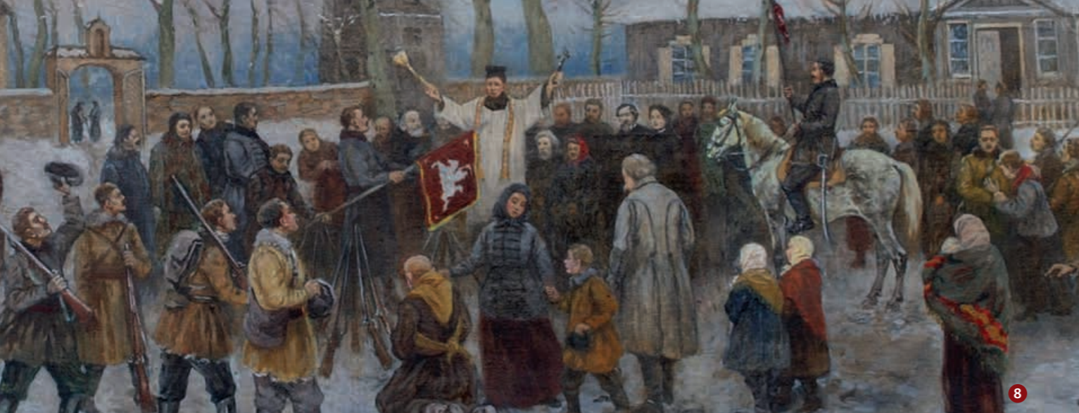
8. Kunigas A. Mackevičius 1863 laimina sukilėlius ir šventina jų vėliavas. Dail. Z. Petravičius, VDKM