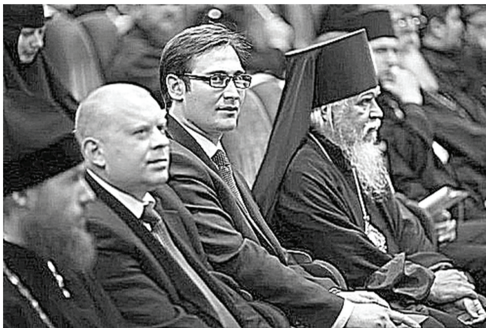
Во время работы съезда.