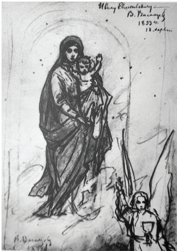
Рисунок В.М. Васнецова. 1871 г.