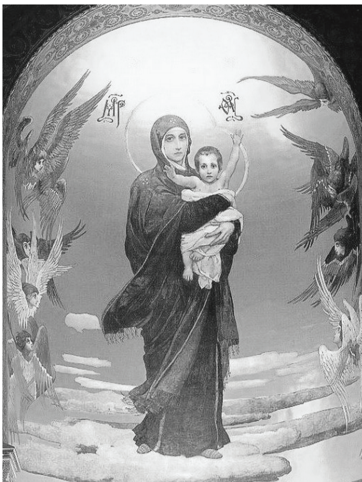
Роспись во Владимирском соборе в Киеве.

письмом, датированным февралём-мартом того же года, сообщает: «Прошу извинения, что несколько замедлил ответом на Ваше письмо. Дело требовало с моей стороны очень серьёзного размышления по огромности своей задачи и по тем исключительным условиям, в которых оно лично для меня поставилось. Поразмысливши, хотя с некоторым страхом, я решаюсь принять на себя серьёзную задачу исполнить предлагаемый Вами труд...»