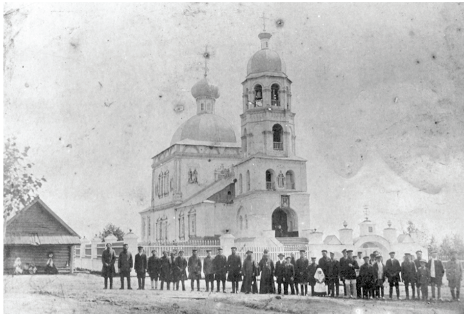
Цепочкинская церковь. Снимок до 1917 г.

На освящение верхнего храма в монастырь приезжал митрополит Казанский Тихон. Еще в начале XX столетия в церкви села Цепочкина хранилась икона Владимирской Божьей Матери с надписью "Сий святой образ приисканием своим усердием от келейного своего прииждивения построил в милости Божией