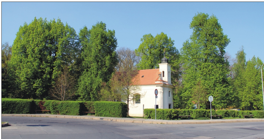
Lípy u kaple sv. Anny krásně dotvářejí příjemnou atmosféru místa