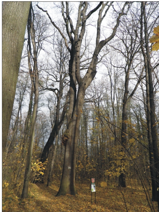
Miranovy duby ve Ctěnickém háji připomínají selské povstání z roku 1775

Nyní můžeme pokračovat hájem až do Ctěnic, kde se nachází zámecký areál. Tam lze navštívit zámek, park nebo velkou expozici historických kočárů. V blízkosti je zastávka autobusu č. 302, který nás může dovézt na konečnou metra linky C Letňany.