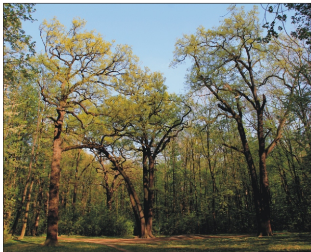
Na centrálním palouku bažantnice nás ohromí mohutné duby

Už od vstupu do bývalé bažantnice je vidět palouk, jemuž vévodí tři památné duby. Historie zdejší bažantnice sahá až do období hraběte Prokopa Černína.