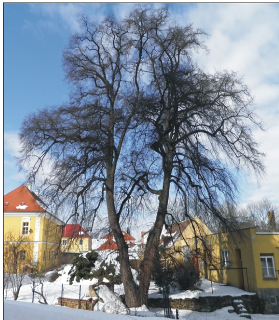
Krásný tvar koruny má lípa srdčitá ve Vinoři

Po prohlédnutí statných stromů pokračujeme dále bažantnicí. Alejí starých jírovců se dostaneme do Vinořského parku. Ten byl v roce 1982 vyhlášen jako přírodní rezervace. Procházíme po krásné pěšině, kolem nás jsou porosty starých listnatých stromů. Kromě