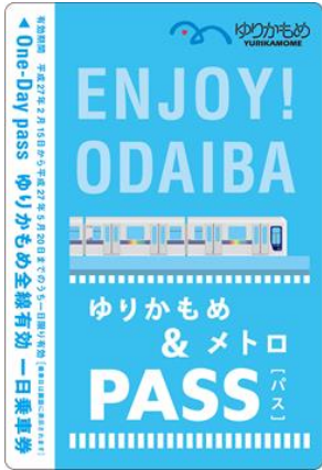
百合海鷗線一日車票