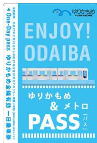
百合海鷗線一日車票