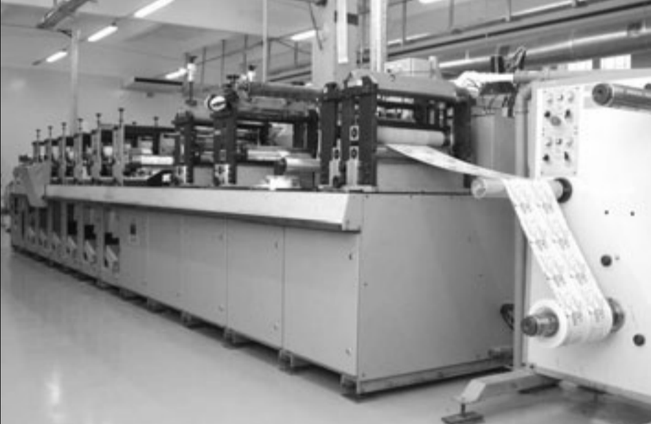
НЕМЕЦКОЕ ОБОРУДОВАНИЕ УЖЕ РАБОТАЕТ