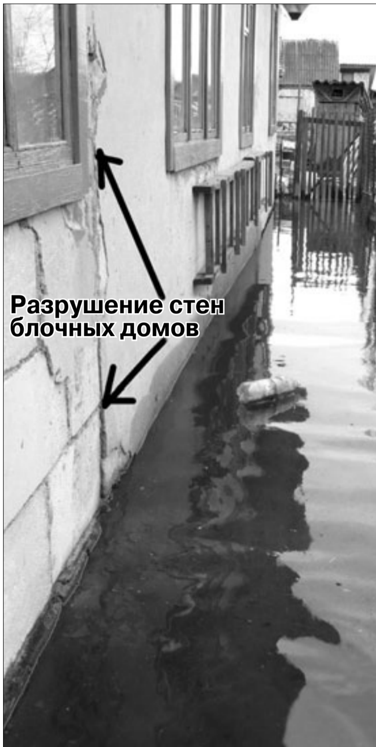
Разрушение стен блочных домов

Проблемы, которые наиболее волнуют людей, традиционные: строительство, ЖКХ, земельные отношения. Впрочем, это закономерно, потому что именно они определяют качество жизни. Обнадеживает то, что в последнее время заметно уменьшилось число жалоб по вопросам дорожного хозяйства, труда, здравоохранения, торговли, культуры, образования и землепользования, что свидетельствует в целом об улучшении этой работы в регионах. Но жизнь идет и подкидывает новые проблемы. Сегодня, например, получение льготных кредитов вызывает огромный поток обращений и вопросов. Если в трудовых коллективах уделяется внимание человеку, ведется работа на упреждение каких-то трудных ситуаций, на высоте идеологическая служба — там меньше и жалоб. Это уже до-