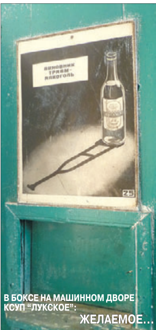
В БОКСЕ НА МАШИННОМ ДВОРЕ КСУП "ЛУКСКОЕ": ЖЕЛАЕМОЕ...

Объектом внимания мобильной группы облисполкома на прошлой неделе стал Жлобинский район