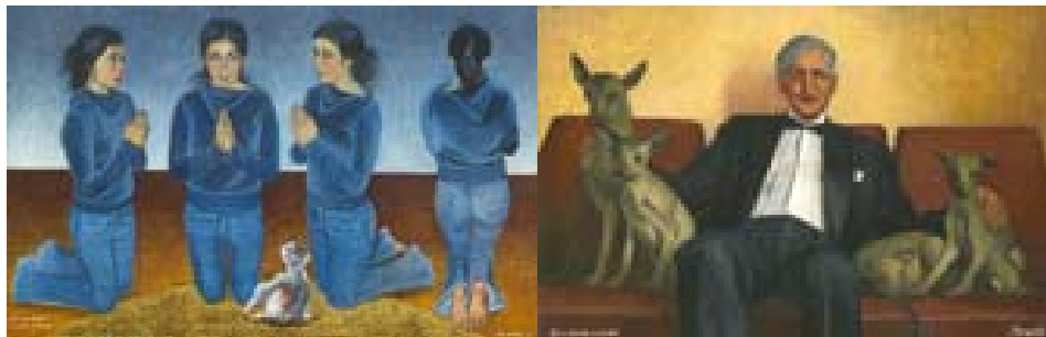
Era un ángel el que me miró