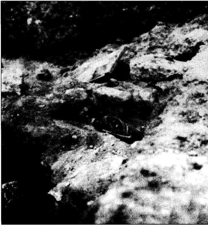
Iċ-Ċimiterju Musulman fid-dar Rumana, ir- Rabat.