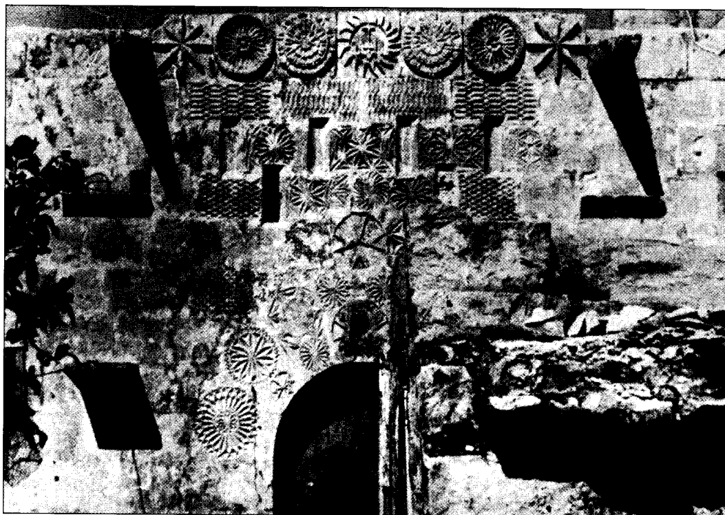
Skultura Musulmana f'Razzett Malti.

darba, waqt li l-kummerċ ta' bosta bliet Ewropej tal-Mediterran dahal fi żmien tad-deheb (Lopez 1971). Lejn is-sena 1000 merkanti minn Amalfi, Pisa, Ġenova, u Venezja, biex insemmi xi portijiet Taljani ewlenin, kienu diġà qed iwettqu kummerċ sfiq fl-ibliet tal-Lvant Nofsani, fl-Imperu Grieg u fl-Afrika ta' Fuq. Mhux kulhadd ried jiehu t-triq tal-kummerċ biex jistaghna; kien hemm min, bħan-Normanni, għażel it-triq tal-gwerra (ix-xogħol klassiku fuq l-Italja Normanna għal bosta snin kien Chalandon 1907; ara wkoll l-istudji migburin ta' Ménager 1981; Loud 2000, 1-11).