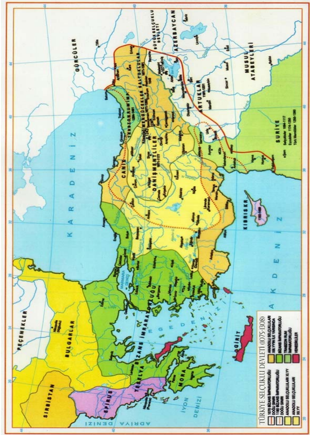
Türkiye Selçuklu Devleti Haritası