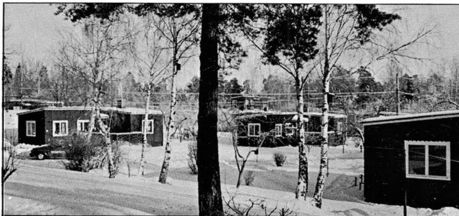
Thun-Olle var arkitekten bakom många hus i Gustavsberg. Ett fint exempel är Höjdshagen, här i vinterskrud.