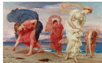
Frederic Leighton Muchachas griegas recogiendo guijarros a la orilla del mar, 1871 (Greek Girls picking up Pebbles by the Sea) Óleo sobre lienzo. 84 x 129,5 cm