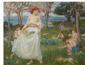
John William Waterhouse El canto de la primavera , 1913 (A song of Springtime) Óleo sobre lienzo. 71,5 x 92,4 cm