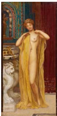
John William Godward Pirra después del baño, 1903 (Phyrria after her Bath) Óleo sobre tabla. 29,3 x 14,3 cm