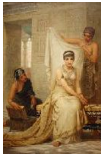
Edwin Long La reina Ester , 1878 (Queen Esther) Óleo sobre lienzo. 214 x 167 cm