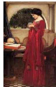
John William Waterhouse La bola de cristal , 1902 (The Crystal Ball) Óleo sobre lienzo. 121,6 x 79,7 cm