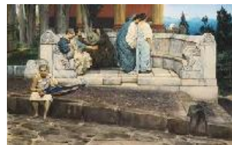
Lawrence Alma-Tadema Exedra, 1871 (An Exedra) Acuarela sobre papel. 40 x 63,8 cm