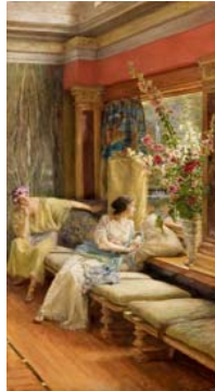
Lawrence Alma-Tadema Cortejo vano , 1900 (Vain Courtship) Óleo sobre lienzo. 76,6 x 41 cm