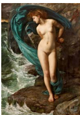
Edward John Poynter Andrómeda, 1869 Óleo sobre lienzo. 51,3 x 35,7 cm