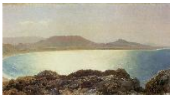
Frederic Leighton Isla de Rodas. Vista de una bahía, 1867 (Bay Scene, Island of Rhodes) Óleo sobre lienzo. 24 x 44,2 cm