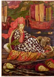
Henry Arthur Payne El mar encantado , c. 1899 (The Enchanted Sea) Óleo sobre lienzo. 91,5 x 65,5 cm