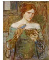
John William Waterhouse Estudio para Jasón y Medea, ( El filtro del amor), c. 1906 -1907 (Study for Medea in Jason and Medea, The Love Philtre) Óleo sobre lienzo. 58,2 x 45,6 cm