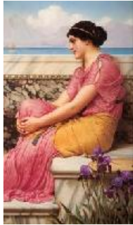
John William Godward La ausencia acrecienta el amor, 1912 (Absence makes the Heart grow fonder) Óleo sobre lienzo. 130,5 x 80 cm