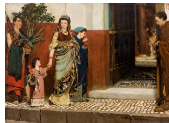
Lawrence Alma-Tadema Volviendo a casa del mercado, 1865 (Returning Home from the Market) Óleo sobre tabla. 40,5 x 56,8 cm