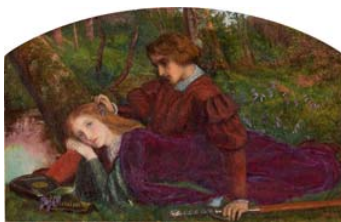
Arthur Hughes Enid y Geraint, 1863 Óleo sobre lienzo. 25,8 x 37,2 cm