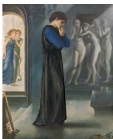
Edward Coley Burne-Jones Pigmalión. Los deseos del corazón, 1871. (Pygmalion. The Heart Desires) Acuarela y lápiz de color sobre papel montado sobre lienzo. 57,8 x 44,5 cm