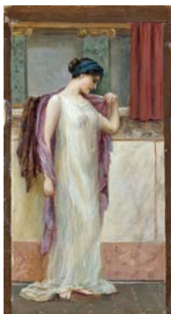
John William Godward En el tepidarium, estudio, c. 1913 (In the Tepidarium. Study) Óleo sobre tabla. 29,3 x 15,4 cm