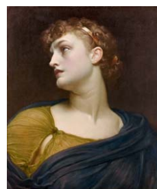
Frederic Leighton Antígona, s. f. Óleo sobre lienzo. 61,4 x 51 cm