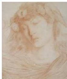
Simeon Solomon Hipnos, el dios del Sueño , 1892 (Hypnos, the Good of Sleep) Sanguina sobre papel montado sobre cartulina. 36,3 x 30,5 cm