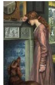
Arthur Hughes Una nube pasajera, c. 1905-1908 (A passing Cloud) Óleo sobre lienzo. 98,8 x 63,7 cm