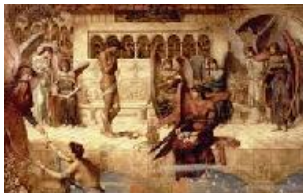
John Melhuish Strudwick Las murallas de la casa de Dios , c. 1889 (The Ramparts of God's House) Óleo sobre lienzo. 61,7 x 86,1 cm