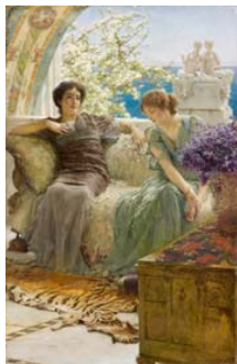
Lawrence Alma-Tadema Confidencia inoportuna , 1895 (Unwelcome Confidence) Óleo sobre tabla. 45,7 x 28,7 cm