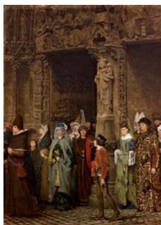
Lawrence Alma-Tadema Saliendo de la iglesia en el siglo XV, c. 1864. (Leaving Church in the fifteenth Century) Óleo sobre lienzo. 56,2 x 39,7 cm.