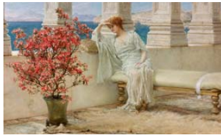
Lawrence Alma-Tadema Su mirada y sus pensamientos se encuentran en la lejanía, 1897 (Her Eyes are with her Thoughts, and they are far away) Óleo sobre tabla. 23,3 x 38,1 cm