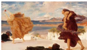
Frederic Leighton Muchachas griegas jugando a la pelota, estudio, c.1889 (Study for Greek girls playing at ball) Óleo sobre lienzo. 17,4 x 29 cm