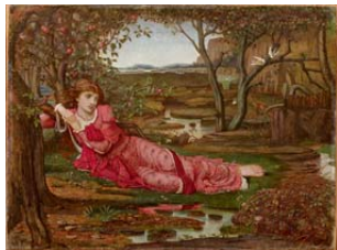
John Melhuish Strudwick Canción sin palabras , 1875 (Song without Words) Óleo sobre tela. 74,3 x 99,8 cm