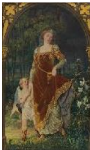
Talbot Hughes La senda del amor verdadero nunca ha sido fácil , 1896 (The Path of True Love never did run Smooth) Óleo sobre tabla. 49,8 x 31,3 cm