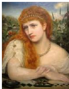
Emma Sandys Ensueño , c. 1873 (Reverie) Óleo sobre lienzo. 50,8 x 40,9 cm