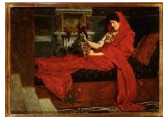
Lawrence Alma-Tadema Agripina con las cenizas de Germánico, 1866 (Agrippina visiting the Ashes of Germanicus) Óleo sobre tabla. 27 x 37,5 cm