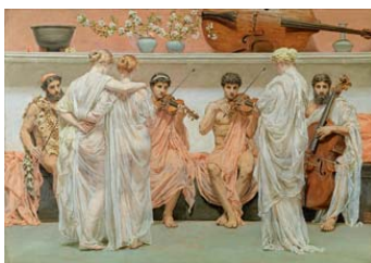
Albert Joseph Moore El Cuarteto. Tributo del pintor al arte de la música, 1868 (A Quartet. A Painter's Tribute to the Art of Music) Óleo sobre lienzo. 61,8 x 88,7 cm