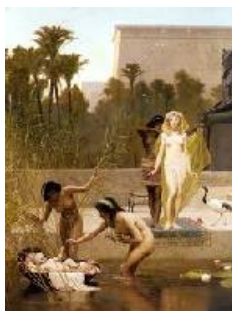
Frederick Goodall Moisés salvado de las aguas, 1885 (The Finding of Moses) Óleo sobre lienzo. 152,4 x 114,2 cm