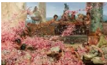
Lawrence Alma-Tadema Las rosas de Heliogábalo, 1888 (The Roses of Heliogabalus) Óleo sobre lienzo. 132,7 x 214,4 cm