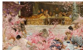
Lawrence Alma-Tadema Estudio para Las rosas de Heliogábalo, 1888 (A Study for "The roses of Heliogabalus") Óleo sobre tabla. 23,5 x 38,2 cm