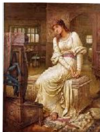
John Melhuish Strudwick Elaine , c. 1891 Óleo sobre lienzo. 79 x 58,8 cm