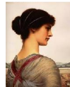
John William Godward Belleza clásica, 1908 (Classical Beauty) Óleo sobre lienzo. 51 x 40,9 cm