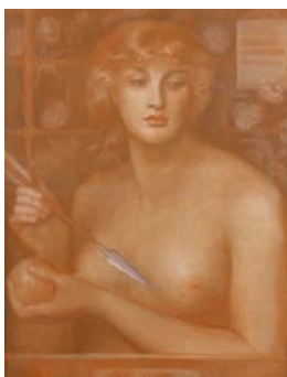
Dante Gabriel Rossetti Venus Verticordia, 1867-1868 Pastel sobre papel. 79,6 x 65,3 cm