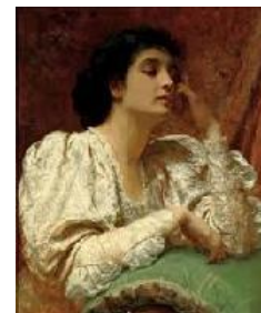
Charles Edward Perugini ¡Por el toque de una mano desvanecida y el sonido de una voz aún presente! , 1896 (But, Oh, for the Touch of a Vanished Hand, and the Sound of a Voice that is still!) Óleo sobre lienzo. 70,3 x 54,8 cm © Colección Pérez Simón, México