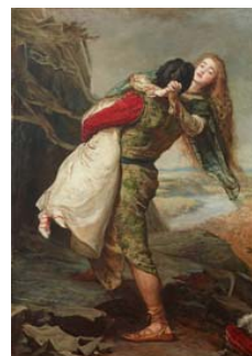
John Everett Millais La corona del amor, 1875 (The Crown of Love) Óleo sobre lienzo. 129,5 x 87,8 cm © Colección Pérez Simón, México