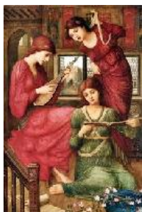
John Melhuish Strudwick En los días de oro, c. 1907 (In the Golden Days) Óleo sobre lienzo. 66,5 x 46,1 cm