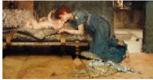
Lawrence Alma-Tadema Paraíso terrenal , 1891 (An Earthly Paradise) Óleo sobre lienzo. 88 x 167 cm