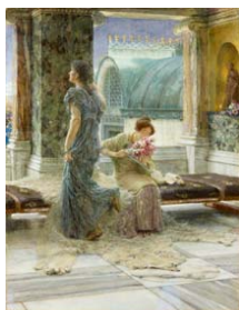
Lawrence Alma-Tadema Misil de amor , 1909 (Love's Missile) Óleo sobre tabla. 49,8 x 37,7 cm