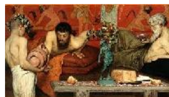
Lawrence Alma-Tadema Vino griego, 1873 (Greek Wine) Acuarela sobre cartón. 18,5 x 37,7 cm