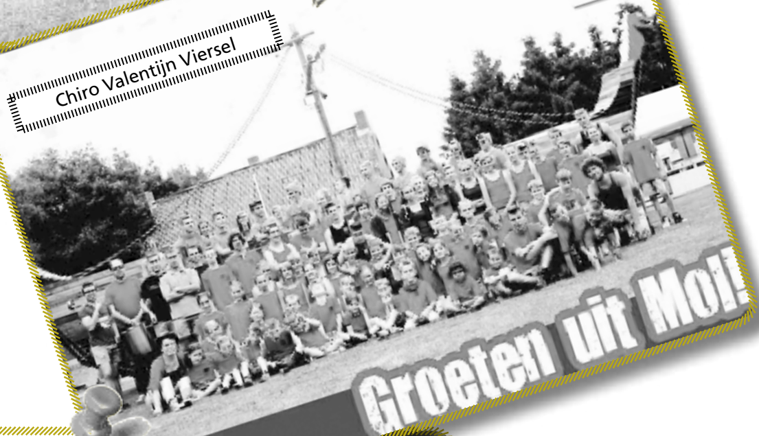
Chiro Valentijn Viersel