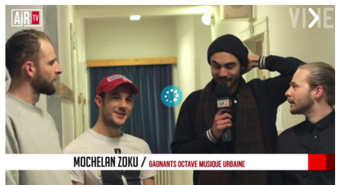
MOCHÉLAN ZOKU / GAGNANTS OCTAVE MUSIQUE URBAINE