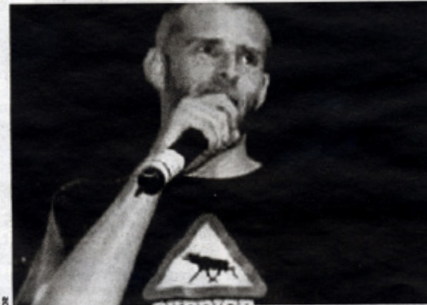
Le slam de Mochélan, demain soir au K'fé Quoi, en partenariat avec le Café Pro.

Le Rock des Tremplins Ca bouge dès ce soir bouge au K'fé Quoi avec le Class'EuRock des Trem-