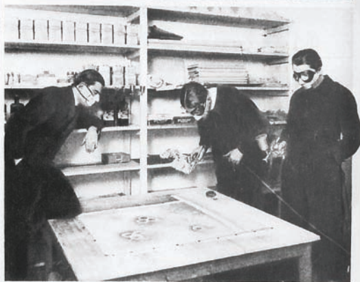
Vzhleda postupu práce stříkačím aparátem.

Při jemném rozprašování barev je nutno zabezpečit se ochrannou maskou.