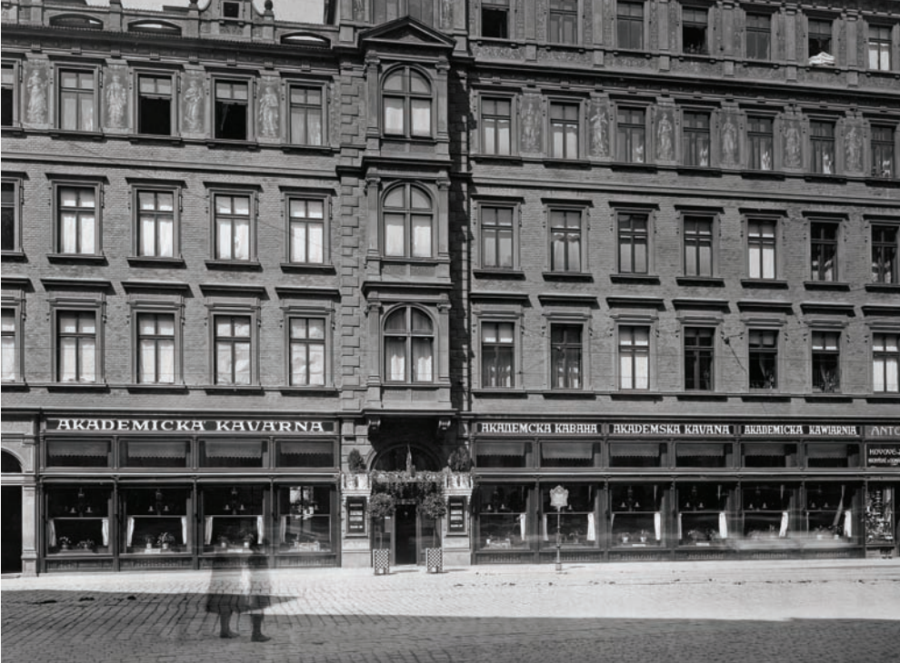
Akadematická kavárna ( www.obrazkarna.cz )

Zde jsem poprvé spatřil muže, který se cítil šťasten, mohl-li neustále otáčeti svým prstenem. Hleděl přitom na biliárové oddělení a na velké stěhování tág.