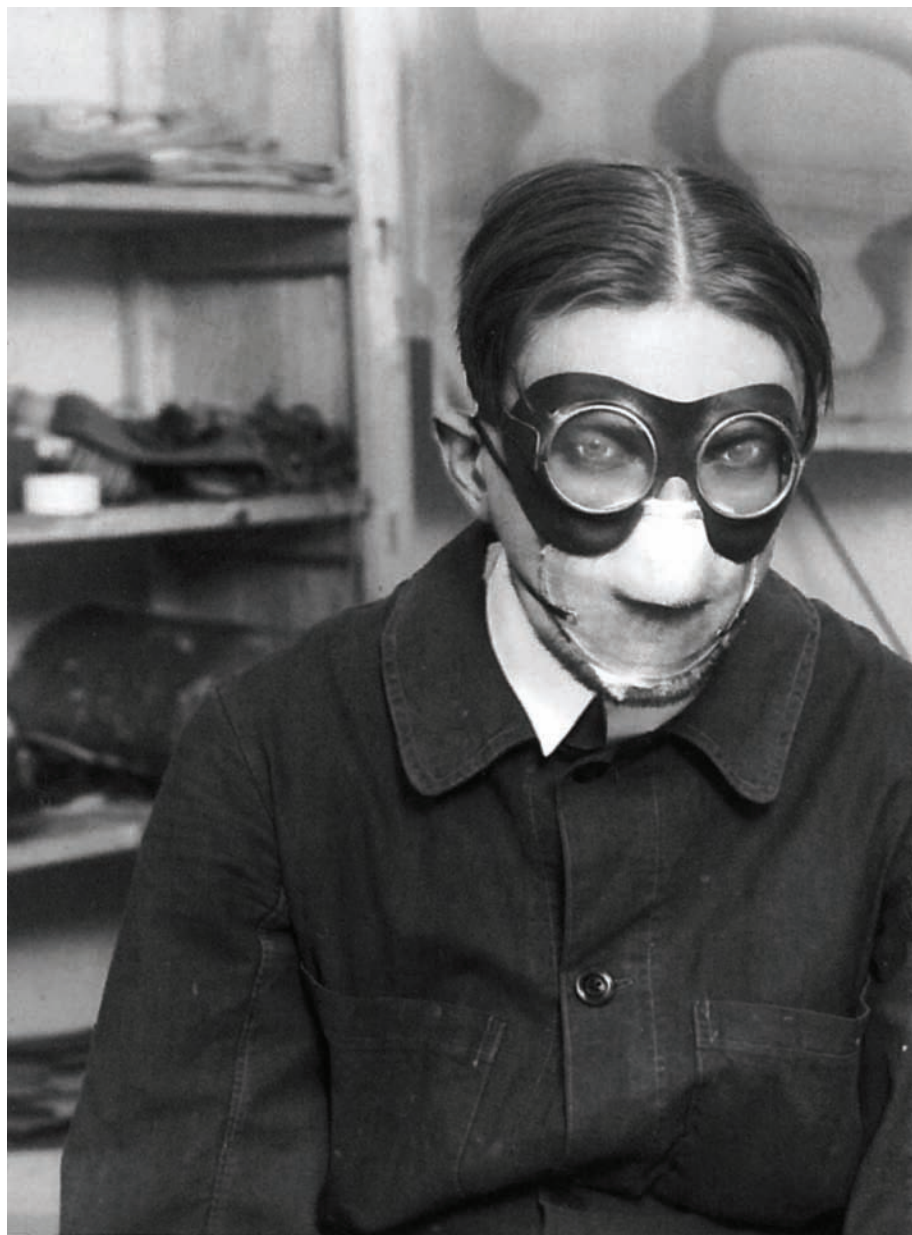
Jindřich Štyrský a Toyen v maskách při práci s „Deka“ barvami (1929)