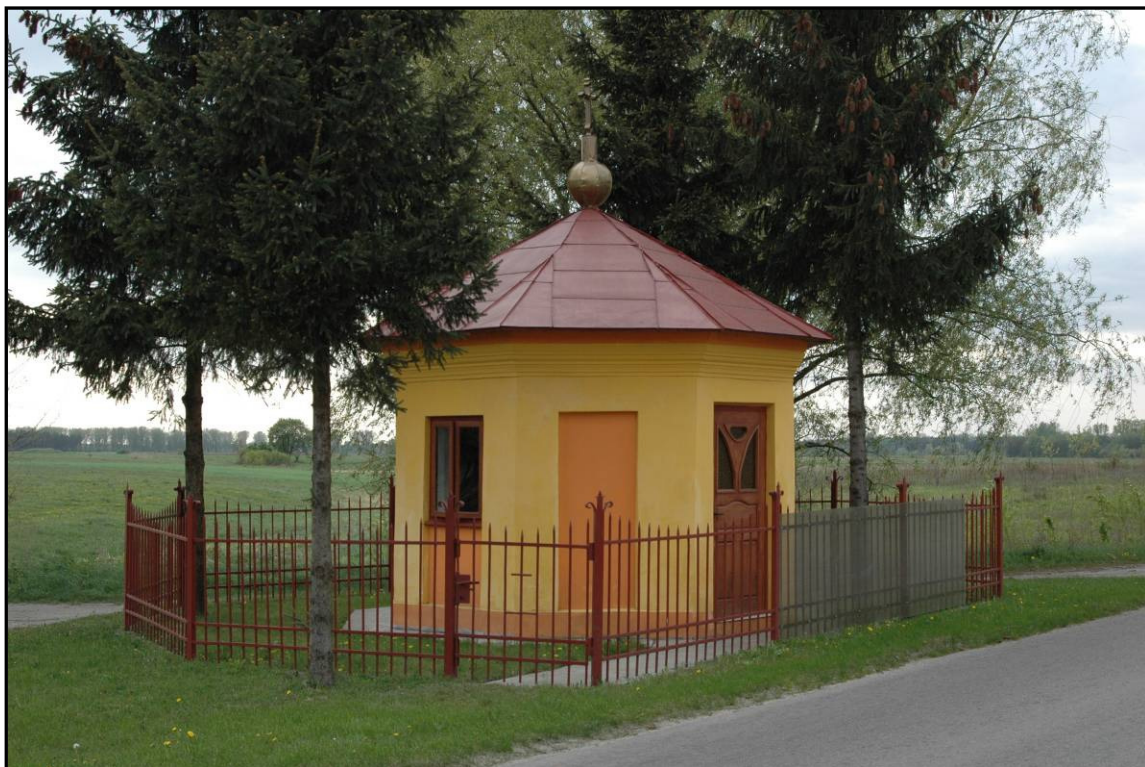
Fot. 8 Tarnawiec. Kaplica