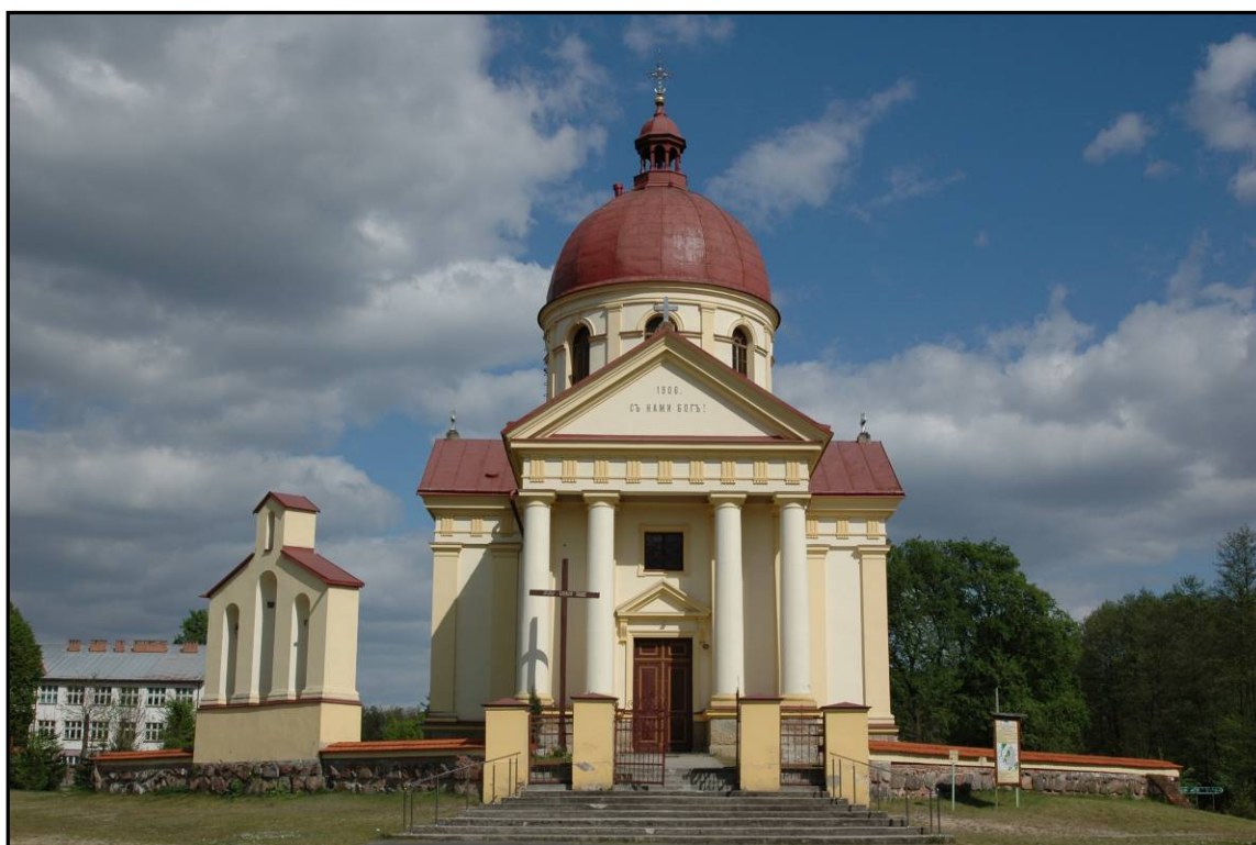
Fot. 4 Dąbrowica. Cerkiew, obecnie kościół filialny