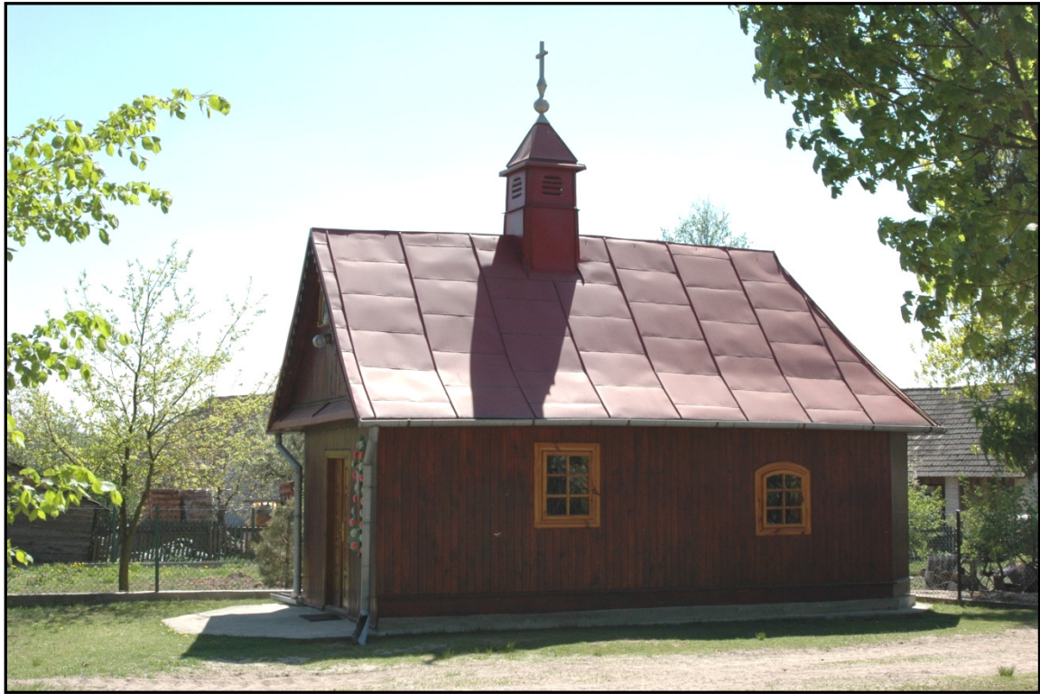
Fot. 5 Brzyska Wola. Kaplica