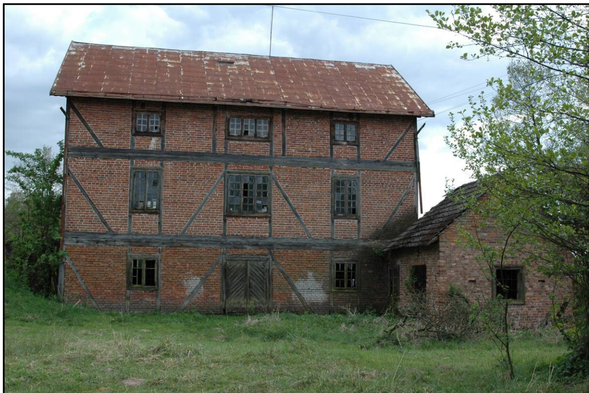
Fot. 10 Ożanna. Młyn