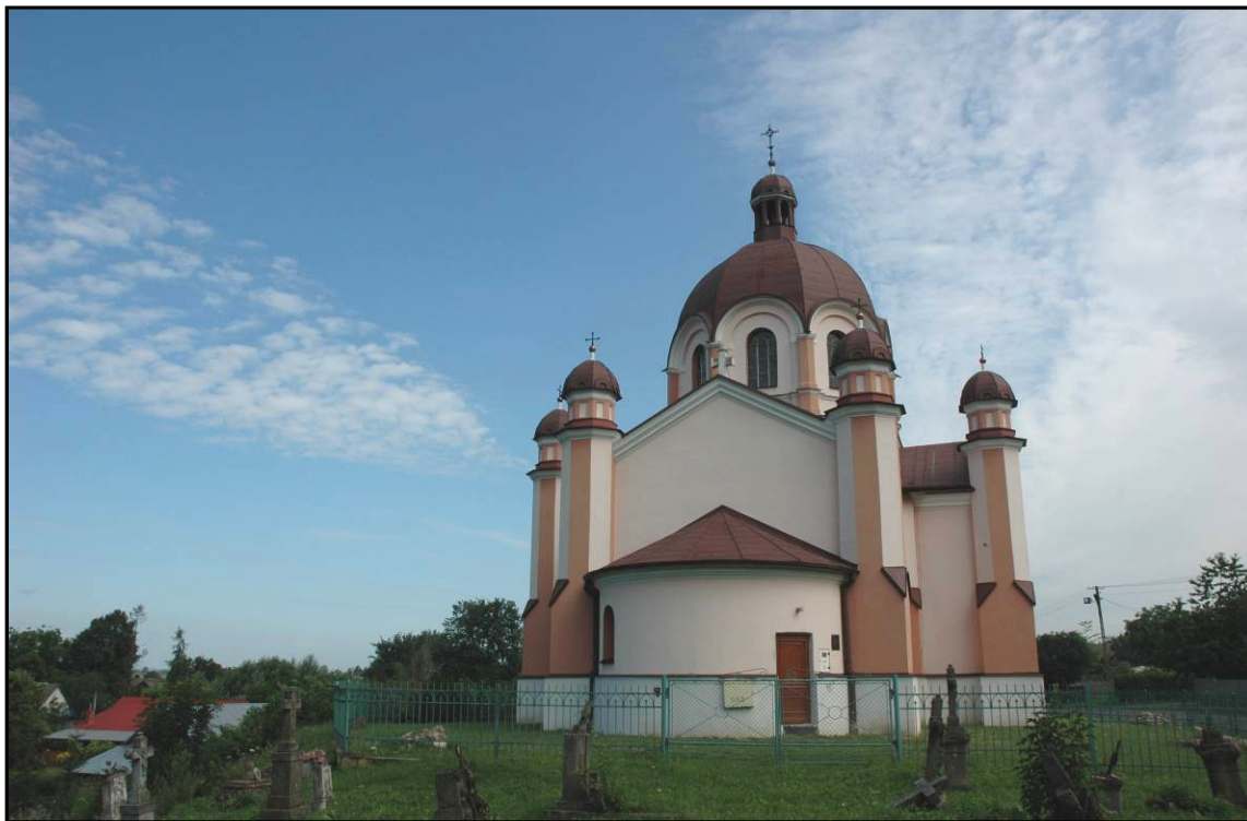
Fot. 1 Kuryłówka. Cerkiew, obecnie kościół filialny