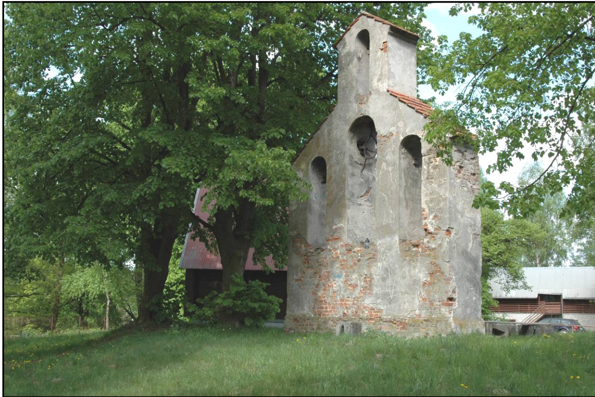
Fot. 7 Ożanna. Cerkwisko, dzwonnica