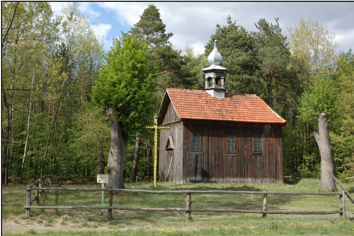
Fot. 6 Dąbrowica. Kaplica