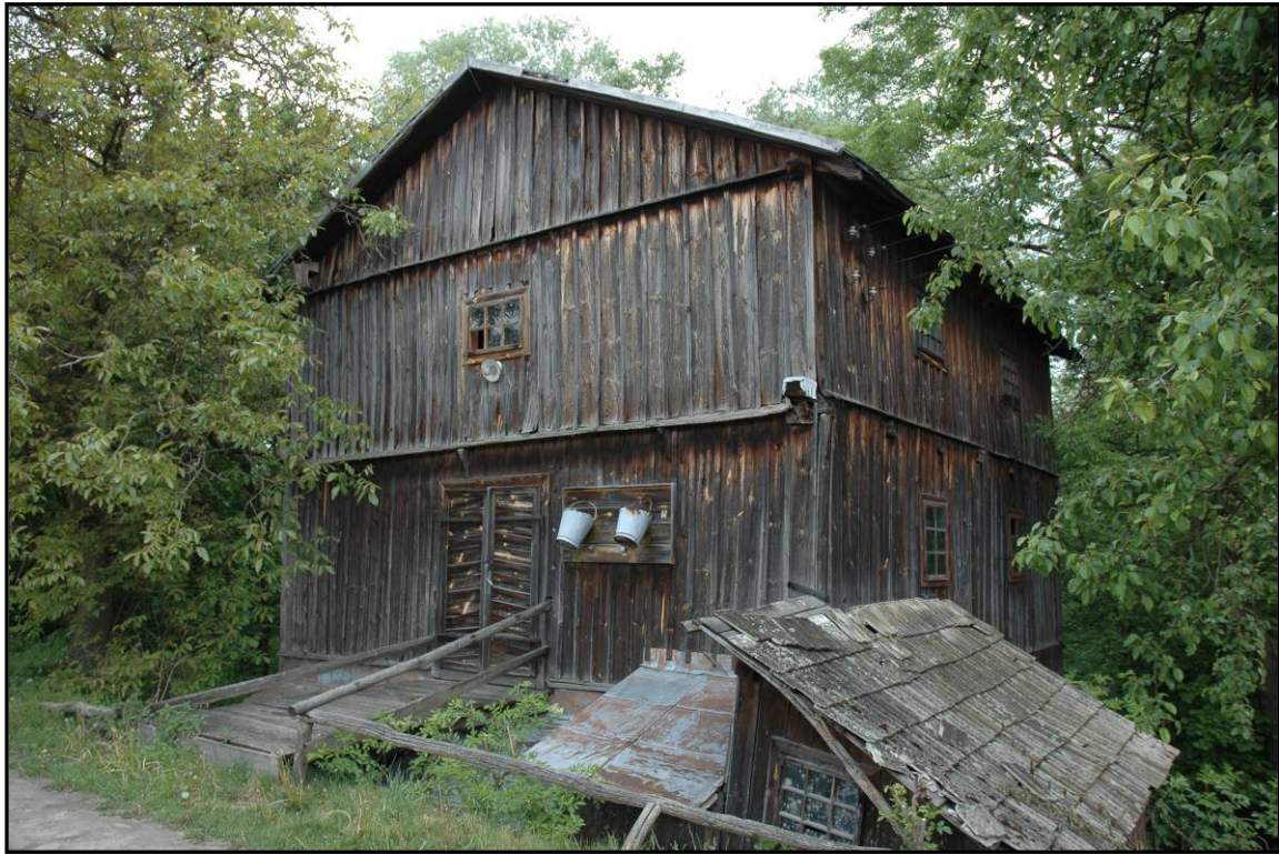
Fot. 9 Kuryłówka. Młyn