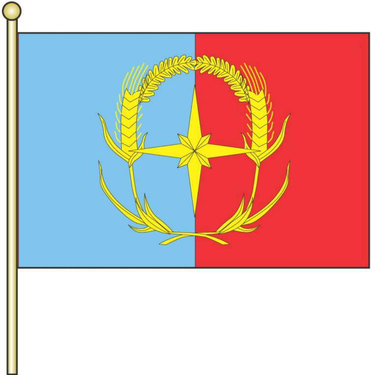
Рисунок флага Андроповского муниципального района Ставропольского края