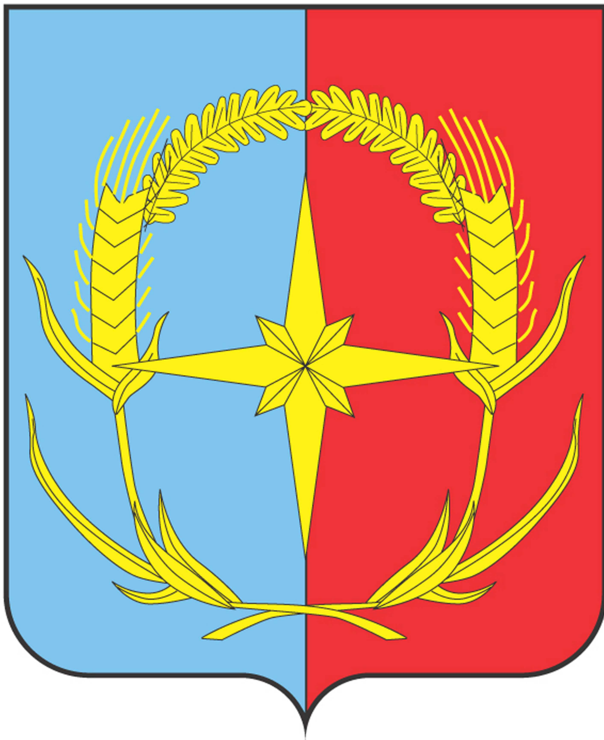
Рисунок герба Андроповского муниципального района Ставропольского края в цветном варианте