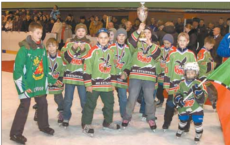
Победители турнира «Золотая шайба» — младшая команда «Юниор-хоккея»

19 января в ледовом дворце Медведкова состоялись финальные игры турнира «Золотая шайба». Проходил он в округе в десятый раз. В этом году в турнире участвовали 27 команд со всех районов. Ребята играли в трех возрастных группах. За последние годы все привыкли видеть в чемпионатах бутырских мальчишек. В этом году младшие завоевали золото, а вот юноши уступили: им досталось серебро.