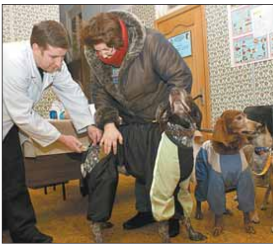
Прививки домашним животным делают бесплатно

Координаты главных государственных ветслужб округа: станция по борьбе с болезнями животных СББЖ СВАО г. Москвы: на ул. Кондратюка, 7, стр. 2, тел. 683 4165; Бабушкинская участковая ветеринарная лечебница: Хибинский пр., 2, тел.: (499) 188 9965, (499) 188 9683, vetsvao@mail.ru