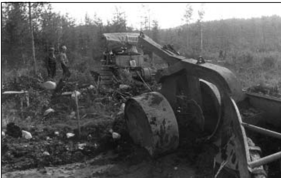
Ojaa tehdään järeillä välineillä. Kuva Pohjois-Karjalasta vuodelta 1958.

Metsänhoitoyhdistysten määrä lähti kasvuun metsänhoitolautakuntien toimiessa katalyyttinä ja vasta perustetun MTK:n metsäpoliittisen valiokunnan kannustamana. Vuonna 1929 toimi 86 metsänhoitoyhdistystä, joiden määrä lisääntyi kymmenessä vuodessa 325:een. Yhdistykset omaksuivat niitä metsänhoidon neuvonnan tehtäviä, joihin metsänhoitolautakuntien resurssit eivät riittäneet.