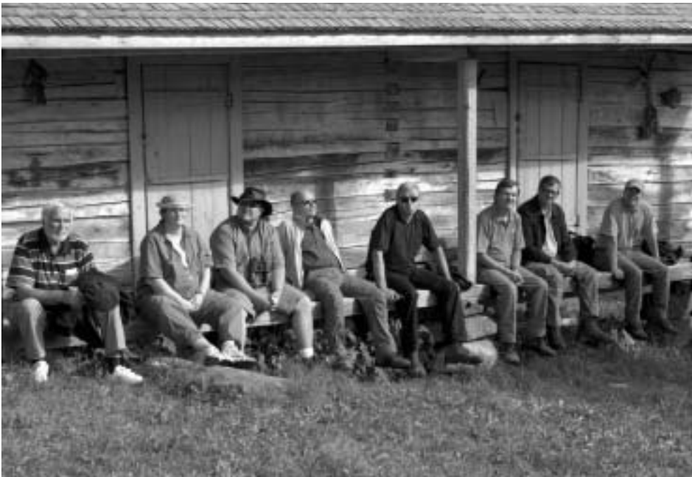
Juhlaretkeilyn osanottajia vilvoittelemassa Linnansaaren kansallispuiston vastaanotto-keskuksen aitan portailla.