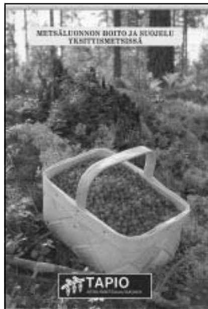
Metsän virkistyskäyttö nosti 70-luvulla päätään. Tapio antoi legendaarisiksi tulleen suosituksensa metsäluonnon hoidosta 80-luvun alussa.

Eräässä tutkimuksessa selvitettiin, että lähes kaikilla suomalaisilla oli 70-luvun lopulla metsään liittyviä vapaa-ajan harrastuksia. Suomalaiset kävelivät metsissä, marjastivat, sienestivät, hiihtivät, hölkkäsivät, samoilivat ja retkeilivät metsissä. Tapio rummutti samaan aikaan avohakkuu - auraus - männynistutuslinjaa metsän käsittelyyn. Vaihtoehtoisista uudistamismenetelmistä puhuttiin jo 80-luvun alussa. Itse puolustin kiivaasti kuitenkin tehokkaita uudistamismenetelmiä.