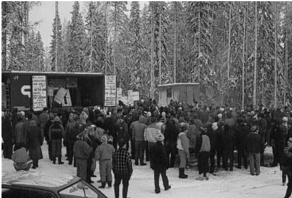
Vieremän Talaskankaalla protestoitiin näyttävästi vanhan metsän hakkuutta vastaan.

Metsänhoitoyhdistykset alkoivat irtautua piirimetsälautakuntien holhouksesta. Yhdistyksiin nimettiin toiminnanjohtajat ja kotitoimistot muuttuivat omiin toimistotiloihin, joissa parhaimmillaan oli vähintään osa-aikainen toimistonhoitaja. Piirimetsänhoitajien tehtävänä oli edelleen lainmukaisuuden valvonta, jota hoidettiin 90-luvun lakimuutokseen muun muassa toimimalla yhdistysten tilintarkastajina.