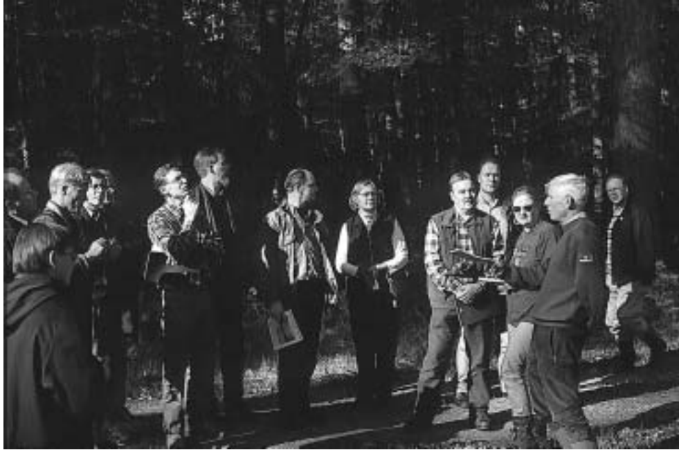
Retkeläiset ovat keskellä Ranskan puuntuotannon jalokiveä. Tronçais 'issa on suurin yhtenäinen, liki 300 vuotta tehokkaassa hoidossa ollut kruunun tammi-metsäalue.

polttopuuksi, oksainen osa ruumisarkuiksi, seuraava osa parketiksi ja tynnyrilaudoiksi ja paras tyvi puusepäntuotteiksi.