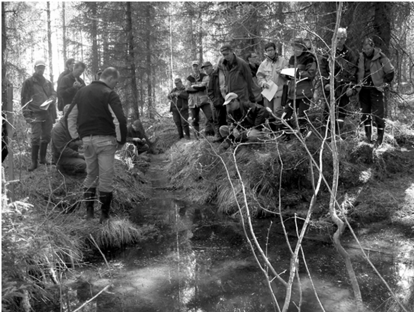
Yhä useampi jäsen saa leipänsä luonnon hoidosta. Kuvassa lähderetkeilyn osanottajia toukokuussa 2006.

1992 Rio de Janeirossa pidetyssä YK:n ympäristö- ja kehityskonferenssissa sovittiin periaatteista, jotka ovat hallinneet metsäpolitiikkaa näihin päiviin. Metsätalouden ympäristöohjelma laadittiin 1993-94. Sitä seurasivat metsälainsäädännön uudistukset 1996-97.