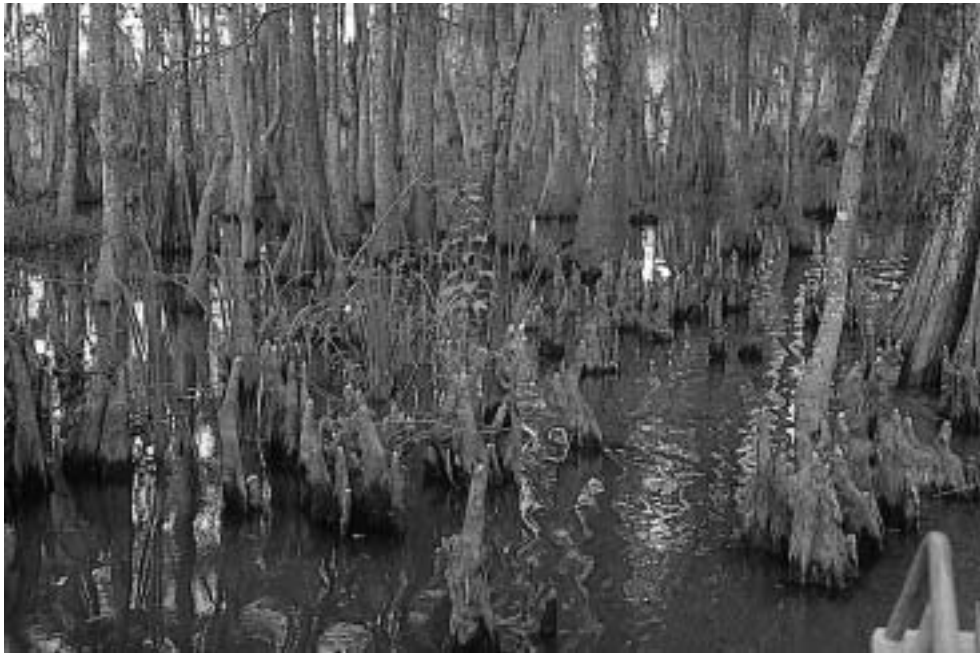
Louisianan rämemetsät ovat ainutlaatuinen kokemus kokeneemmallekin matkailijalle.

Erityisen mieleenpainuvia ja hikisiä olivat kohteet etelän kuumen auringon alla. Opittiin tuntemaan monet mäntylajit: Southern Pine eli Etelän mäntyä on neljä eri lajia, Loblolly pine (P. taeda), Slash pine (P. Elliottii), Shortleaf pine (P. echinata) ja Longleaf pine (P. palustris). Southern Forest Laboratoryn koeasemalla Missisipissä tutkitaan mm. termiittien kemiallista torjuntaa, erilaisia syöttimenetelmiä sekä rakennusten puutavaran suojausmenetelmiä. Termiittit aiheuttavat maailmanlaajuisesti tähtitieteellisiin summiin nousevia tuhoja. Sysäys termiittituhojen estämistutkimuksiin sai alkunsa siitä kun termiittit tuhosivat armeijan ammuslaatikoita.