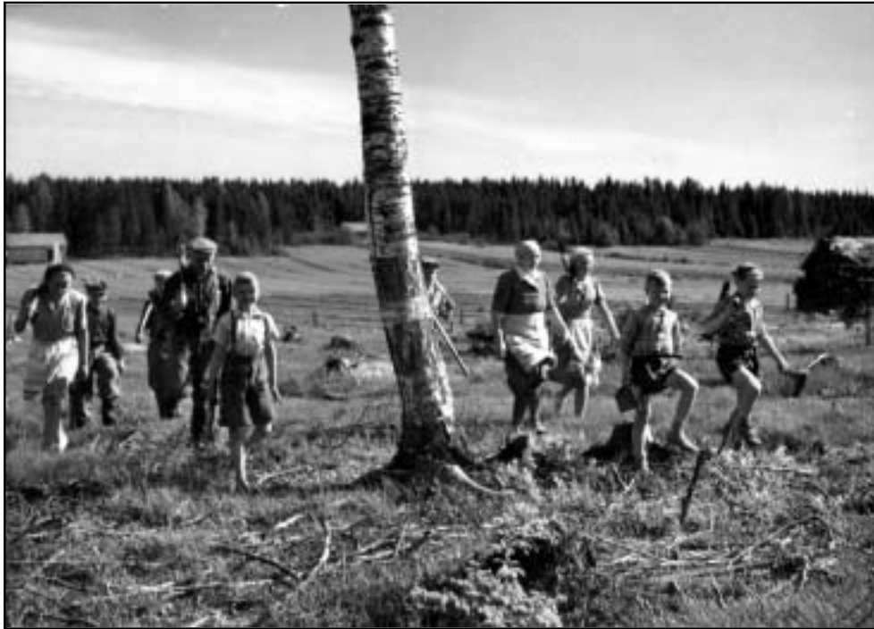
Tapion organisoima Metsämarssi 1952 oli yksi mittavimmista ja näyttävimmistä metsätalouden neuvonta- ja viestintätempauksista maassamme. Metsämarssissa oli tavoitteena saada perheet kiinnostumaan metsänhoidosta. Tempaus onnistui varmasti yli odotusten.

Lain valvonta oli sotien jälkeen vielä vähäistä ja metsäammattilaisten aika meni asutustilojen metsien käytön ohjaukseen. Metsänhoitoyhdistyslain säätämisen ja samana vuonna toteutetun metsämarssin jälkeen alkoi ennennäkemätön metsänhoidollinen innostus.