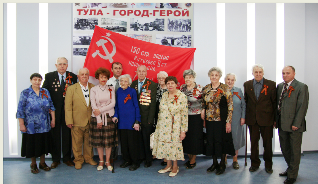
Ветераны «Тулэнерго» – участники войны и трудового фронта с копией Знамени Победы. 2010 год

Представитель династии энергетиков, трудовой путь начал в 1976 году электро-монтером Щёкинской ГРЭС. В 1984 году с отличием окончил Ивановский энергетический институт по специальности «Электрические станции». С сентября 1984 года занимал должность начальника смены сначала электрического цеха, затем электростанции. С 1998 по 2005 год работал директором филиала «Щёкинская ГРЭС» ОАО «Тулэнерго». С апреля 2005 года и по настоящее время является директором «Тулэнерго». Заслуженный энергетик Российской Федерации. Высокий профессионализм отмечен рядом ведомственных и отраслевых наград, благодарностями губернатора и регионального правительства. В 2008 году награжден Русской православной церковью орденом преподобного Серафима Саровского I степени. В 2013 году Белевской епархией – медалью Святого преподобного Макария Жабенского и Белевского II степени.