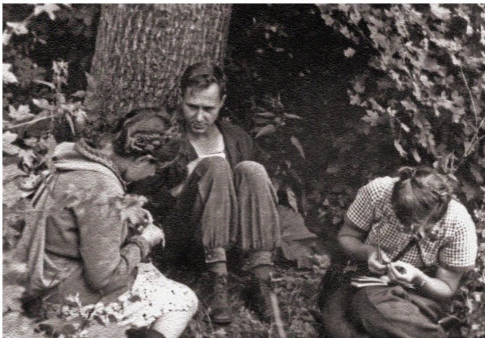
В Савальском лесхозе. Начало 1950-х годов.