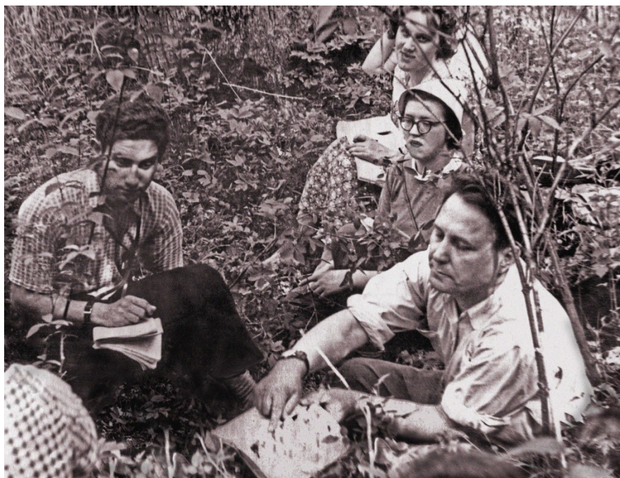
Практика по зоологии позвоночных. Старый Петергоф. Июнь 1961 года.