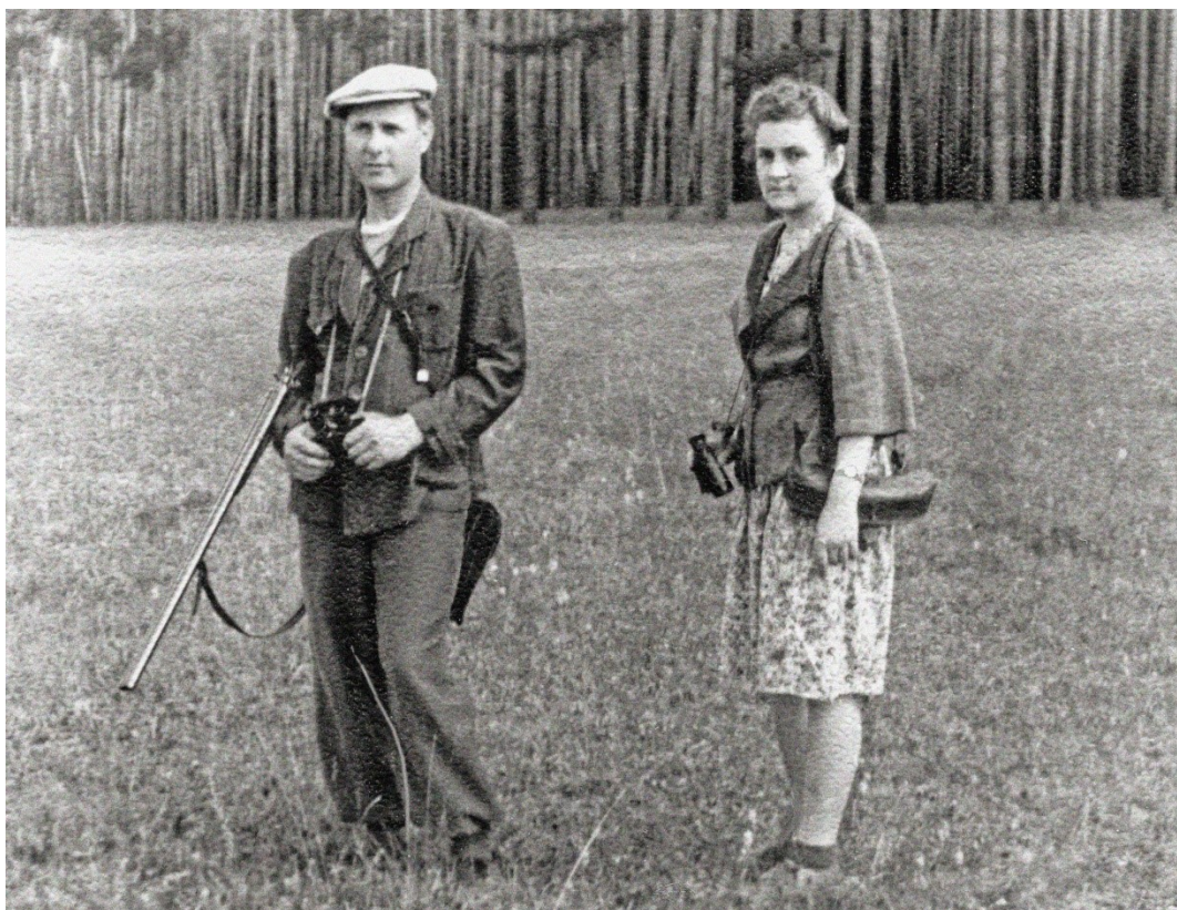
В Савальском лесхозе. Начало 1950-х годов.