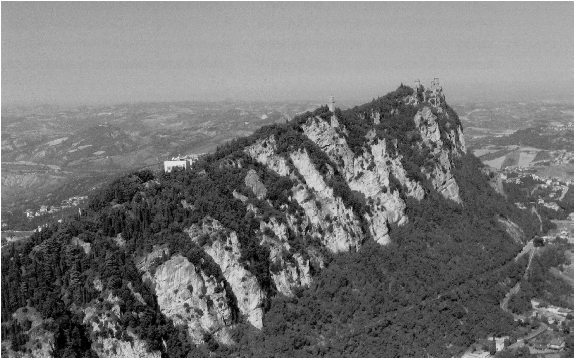
View of Mount Titano from East