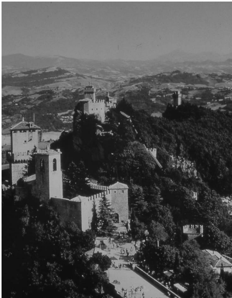
The three Towers