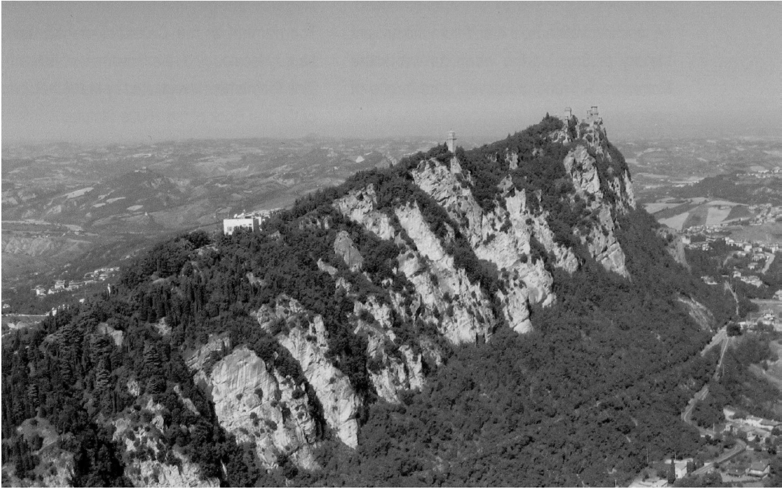
Vue depuis l'est du mont Titano