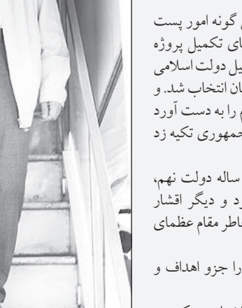
امیر حسین تاقی

برای تیل به این مقصود، ابتدا لازم است به تیرماه سال ۱۳۷۸ و ایام انتخابات ریاست‌جمهوری نهم برگردیم و در این سفر تاریخی، بررسی کنیم که آقای احمدی‌نژاد در آن دوران بزرگ، خود را چگونه به ملت عرضه نمود و چگونه در قلب میلیون‌ها ایرانی عشق ولایت جای پیدا کرد. بی‌تردید همانظوری که بارها مقام معظم رهبری فرموده‌اند؛ از اقبال حقیقی میلیون‌ها مسلمان تشنه عدالت و دوستدار امامت و ولایت، از آقای احمدی‌نژاد در انتخابات تیرماه ۱۳۷۸ را باید در شعارهای انتخاباتی و تقریرات و اشارات احمدی‌نژاد جستجو کرد.