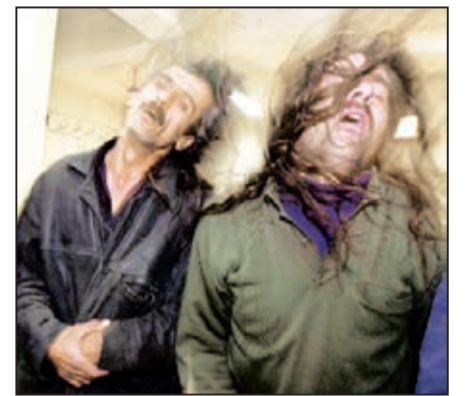
سردار احمدی مقدم: