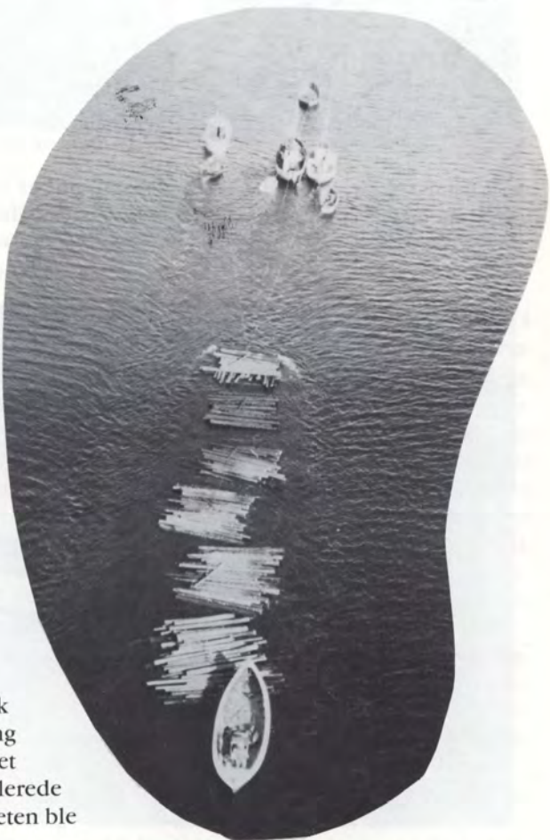
Kirketømmeret slepes til Otterøya for å sages.

Som nevnt i vårt historiske tilbakeblikk gikk menigheten igang med å bygge sitt eget kirkehus på Tøtdal allerede året etter at menigheten ble