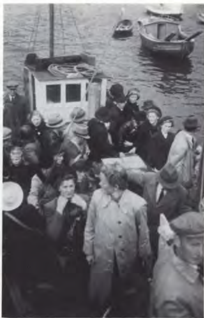
Kirkeveien var ofte sjøen og da kom en ikke utenom båten.