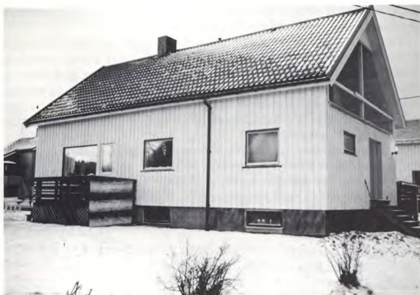
Nyrestaurert pastorbolig høsten 1989.