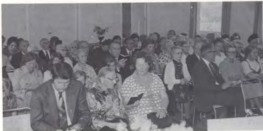
Møtesamvær i Betehl

Dagen etter, 23. juni var menigheten for første gang samlet til nattverd. Det var møtt frem mye folk for å se denne enestående begivenhet. Og det sies det var en fin dag med strålende solskinn. Det var bedt mye til Gud for denne dagen — og Herren svarte med rik velsignelse. Hundere foretok innvielse av forstander og eldste. Deretter samlet menigheten seg om nattverdbordet. Det var en gripende stund, og Herren fylte deres hjerter med takk og glede. Så sto menigheten ferdig til å ta fatt på sitt arbeid i Guds rike.