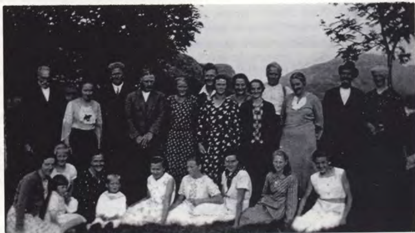
Ungdomsforeningen «Vinkvisten» har møte i Vasslia 1936.