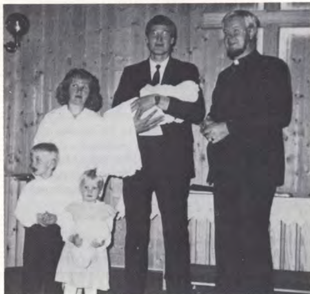
Dåp er festdager i menigheten

Gud gav oss en velsignet og dyrebar stund om ord og sakrament.