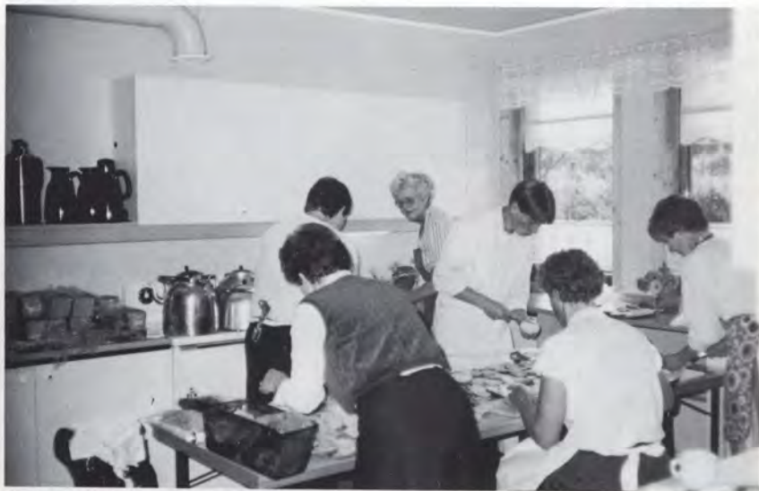
Fest og mat bærer sammen.