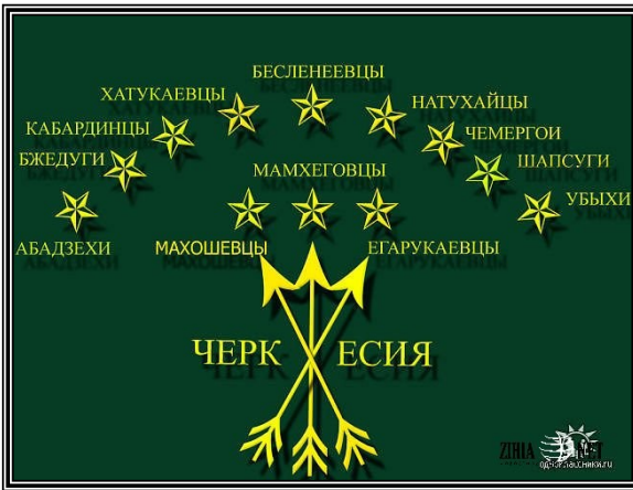
Рис. 5. Адыгский флаг с вписанными названиями западнокавказских племен.

Для начала предлагаю изображение адыгского флага с наименованиями двенадцати племён опубликованное на сайте http://zihia.org http://heku.ru . (рис. 5).