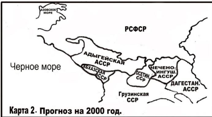
Рис. 1. Карта республик Северного Кавказа в 1990 г. и прогнозируемые изменения на ней к 2000 г.

В 1991 году к власти в России пришел Б. Ельцин. В этом же году СССР развалился, как карточный домик. США сразу же