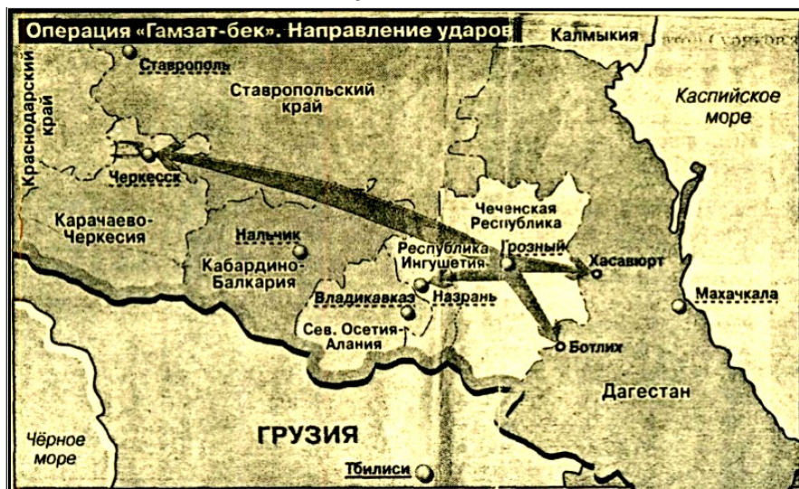
Рис. 2. Направление ударов сил сепаратистов по плану «Гамзат-бек». Четко отмечено, что главные удары сепаратистов намечались по Дагестану и Карачаево-Черкесии.

В 1996 г. один из идеологов МЧА в Иордании Имран Абаза писал: «Российские войска не смогут сохранить единство Российской Федерации, особенно после Чечни, если теперь встанут Дагестан и Кабарда с требованием суверенитета» 62 .