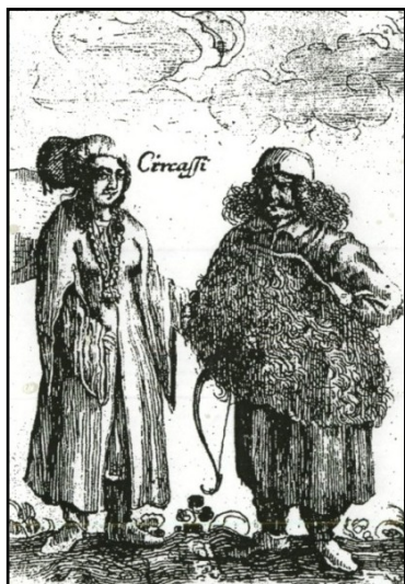
Рис.3. Черкес и черкешенка по А. Олеарию.

Вот как выглядели черкес и черкешенка по рисунку очевидца – путешественника А. Олеария (рис.3).