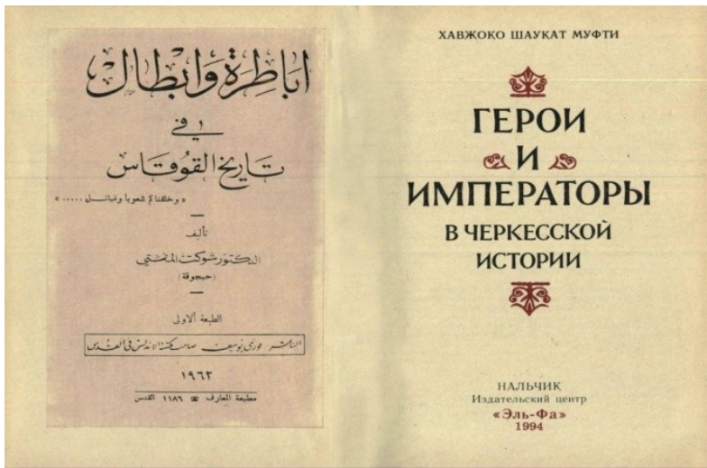
Рис. 8. Титульный лист книги Ш. аль-Муфти на арабском и ее нальчикского издания на русском языке.

ператоры в черкесской истории», т.е. вся кавказская история в один миг превратилась в черкесскую (адыгскую). Предлагаю вашему вниманию оригинал названия этой книги на арабском языке и искаженный в переводе на русском языке (рис.8).