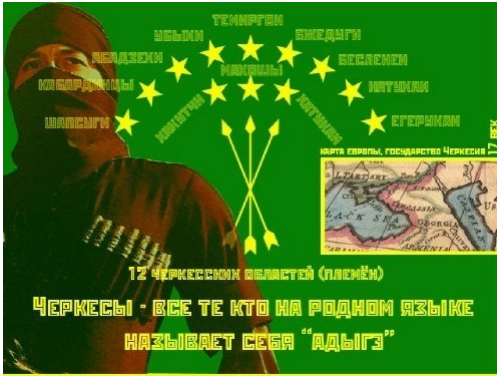
Рис. 4. Племенной состав черкесов согласно мнению адыгских националистов.

В XXI в. Черкесами стали называть себя некоторые представители всех современных адыгоязычных народов, по политическим мотивам (рис. 4).