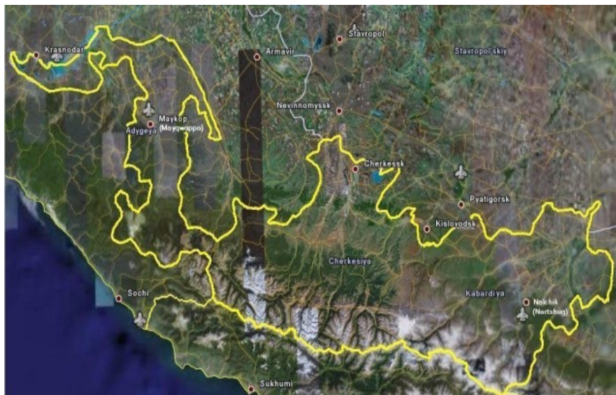
Рис. 1. Карта так называемой «Великой Черкесии».