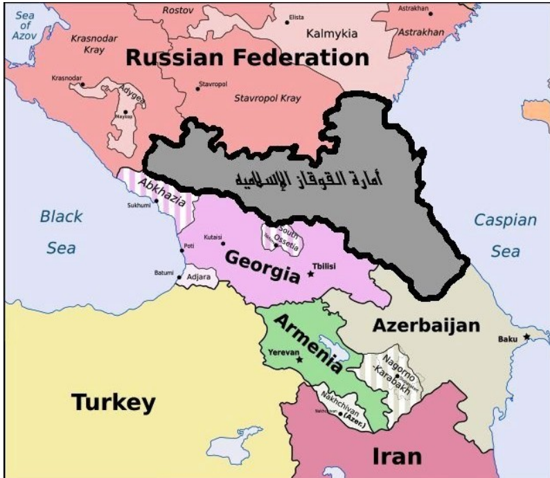
Рис. 2. Карта так называемого «Исламского Кавказского эмирата».

Именно об этом я писал ещё 15 лет назад, а сегодня это мнение поддерживает множество политологов.