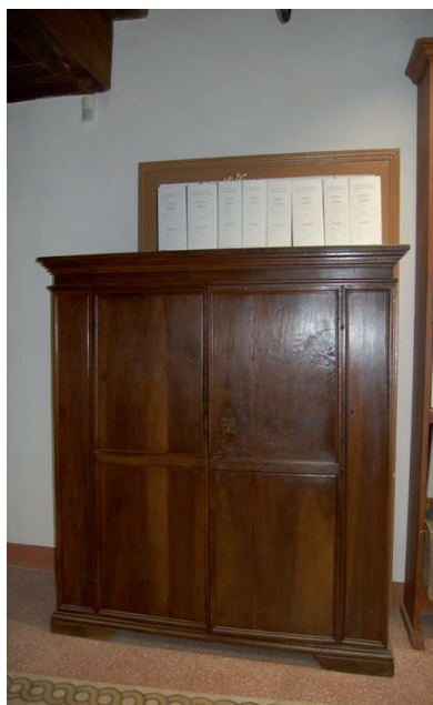
Figura 3. Armadio contenente l'Archivio storico della Diocesi di Castro

L'arco cronologico è compreso tra il XV secolo ed il 1649; lo stato di conservazione è prevalentemente mediocre. Le unità sono state ordinate secondo un criterio cronologico.