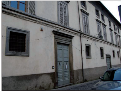
Figura 1: Palazzo vescovile di Acquapendente

All'Archivio storico della Diocesi di Acquapendente sono aggregati diversi archivi: Archivio delle confraternite di Acquapendente ed Onano, Archivio del monastero di S. Chiara di Acquapendente, Archivio del Monte di Pietà di Acquapendente, Archivio del Seminario e dell'Ospedale di Acquapendente, Archivio delle Opere Pie di Acquapendente, Proceno ed Onano, Archivio dell'Azione Cattolica di Acquapendente, Archivio del Capitolo di Acquapendente, Archivio della confraternita del SS.mo Sacramento di Acquapendente 5 .