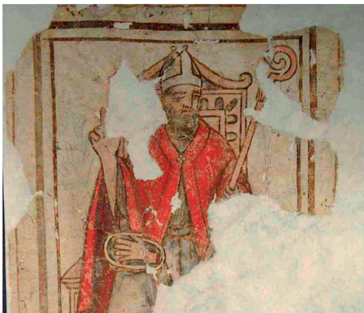
Figura 1. Miniatura di S. Savino, vescovo di Castro

All'Archivio storico della Diocesi di Castro sono aggregati gli archivi della confraternita di S. Giovanni Evangelista, della Misericordia, del SS.mo Sacramento e l'Archivio del Capitolo di Castro 17 .