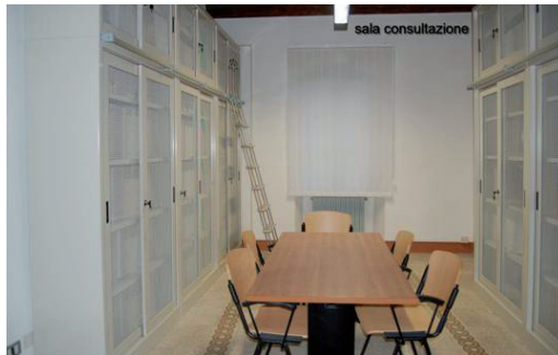
Figura 3. Archivio storico delle Diocesi di Castro e Acquapendente - sala consultazione

Il lavoro di riordinamento ed inventariazione della documentazione appartenente all'Archivio del Capitolo di Acquapendente, all'Archivio della confraternita del SS.mo Sacramento di Acquapendente e all'Archivio del Capitolo di Castro è stato realizzato nel 2005-2006 con un finanziamento della Fondazione Cassa di Risparmio di Roma.