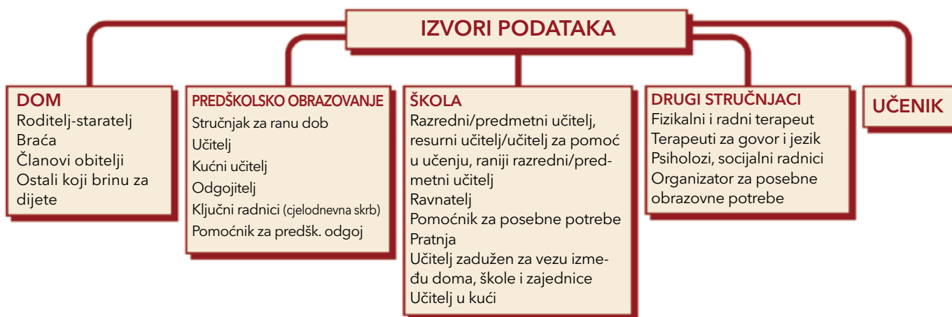
Crtež 1. Izvori podataka

Dom, škola i društvena zajednica dobri su izvori podataka o djetetu s posebnim potrebama. Takvo dijete vjerojatno kontaktira s različitim stručnjacima koji su formalno i/ili neformalno procijenili njegove jake strane i potrebe. Crtež 1 ilustrira moguće izvore podataka karakterističnih za proces individualnog obrazovnog plana.