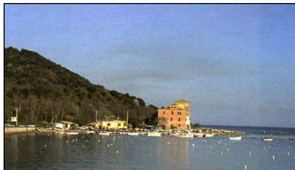
La torre oggi