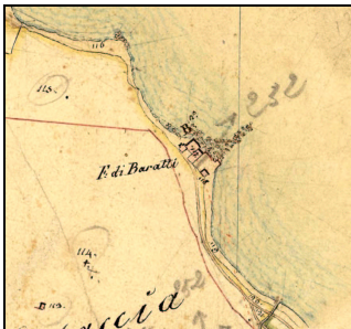
Inquadramento storico su Catasto Leopoldino

Nella mappa del catasto storico del 1821, si rileva una configurazione planimetrica diversa dall'attuale. All'epoca esisteva solo la torre ed un più piccolo edificio aderente ad essa, sul fianco sinistro guardando dal mare, e sempre da questa parte una piccola dipendenza distaccata a circa venti metri dalla Torre. Per quanto riguarda l'alzato, si può tentare un raffronto con altre torri della stessa tipologia notando che di solito finivano in alto con una loggia coperta a tetto destinata alla batteria. Al piede, era di solito presente una scala esterna che da terra conduceva al primo piano ove era posto l'unico accesso all'interno della Torre.