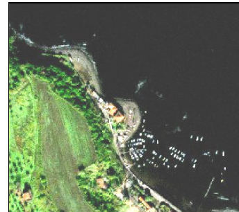
foto aerea dell'area