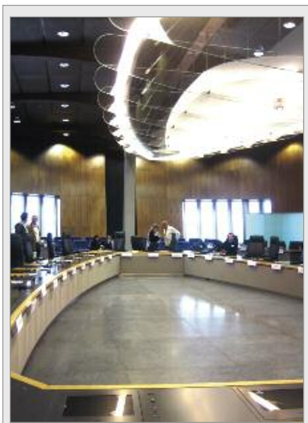
'Korunovační komnata' Ústředního kartelového úřadu v bruselské EU. Zasedací místnost 'Komise EU' na 13. poschodí bruselského ústředí.

e) Bude zapotřebí, vytvořit všeobecné zásady regulace trhu pro evropský velkoprostor. Ohledně úprav trhu a kartelu bude zapotřebí vytvořit podobná pravidla, stejně jako v případě hospodářských dekretů, které byly vypracovány resp. na nichž stále ještě pracuje Ministerstvo hospodářství pro účtovací soustavu.