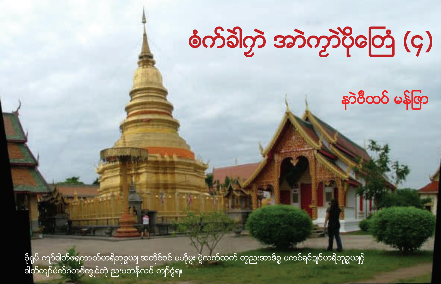
ဗိုရုပ် ကျာ်ဝါတ်ဖရတောတ်ဟရိဘုဉ်ယျ အတိုင်ဝင် မဟိုမွဲး ပွဲလက်ထက် တ္ၚးအာဒိစ္စ ပကင်ရင်ချင်ဟရိဘုဉ်ယျာ် ဝါတ်ကျာ်မံက်ဂတပ်ကျင်တို ညးပတန်လပ် ကျာ်ဝံရ။

နူချင်ဇင်မဲး (ချင်သေံ) ဒီတိတ်အာလုပ်သျှင်ကျာ် ဝံင်ဒဒန်နဝရာတ် သိုဖအိုတ် ဓိတ် ၂၆ ကီလပ်မိတာမွဲး စိုပ်ချင်လာမ်ဖန် နကိုယျတြံ ဟရိဘုဉ်ယျ မဒိဒတန်မန်တြံရ။ စိုပ်ချင်လာမ်ဖန်တို နှံင်ဇော် လပ်ဝါတ်ပိာ်ဂံ ဝံင်ဆိုကောတ် ကျာ်စေတီဘာဝါတ်ဖရတောတ် (Wat Pra That Haripunchai) ဝဲမသပွယ်တို နူလဒေါပ်ချင်လာမ်ဖန် လပ်ပလိုတ် ဗက်အာဝံင်စမ္မဒေဝီ (Chamathevi Rd.) မွဲး စိုပ်ခွဲ နန်တြံတို ဝဲကိပ်ကွာ ဝံင်ဆိုကောတ် ဘာမဟာဝန် ဝတံင်ညိုပွန် ဝံင်ဆိုကောတ် ကျာ်ကုကုတ် (ကျာ်စမ္မဒေဝီ)ရ။ ကျာ်စေတီဇေဝီဝံင် ဝဲကျာ်စေတီ မွဲးစိုပ်နီကွင် မွဲးကိပ်မသန်ကဆံင် ပွဲခွဲခွဲကွင်မွဲး နွံကျာ် ပဋိမာရုပ်စိုသုန်။ သာ်ဂံမွဲး သိုဖအိုတ် ပဋိမာရုပ် နွံ ၆၀ ဇကုရ။