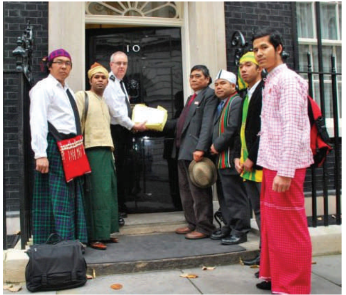
ပိုမိုဟ်စူးဂကောံဂမ္တိုင် ကြံတု သိုကိုမန် လုပ်ပအပ် စွတ်တဲ ကုဂန်ဇော်ချင်ဗြိတိန် ပွဲရင်ဝန်ဇော်ဗြိတိန် ဝွန် (၁၀)။