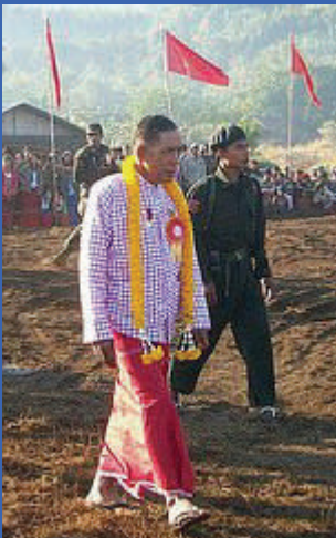
သွာန်သွဟ် နဲထဝ်မန် (ဥက္ကဋ္ဌ ဗော်ချင်မန်တို့) မုက် ၈ - ၁၂

“မန်သိုဖအိုတ် ကျွန်ဟောင် စိုပ်တရ်မန်ဂိုရ အလုံဂကုမန် မန်မရပ်လွဟ်ကို၊ မန်ချင်မန်ကို၊ မန်ချင်သေံကို၊ မန်မစိုပ်ချင်မူးကို သိုကိုခမိသင် ညိုင်ဝံ့ဒ် မွဲကသပ်မွဲဂွန်တဲ ဇက်အာ မွဲတရ်တိုင်ပွဲ ချင်မန် ကော်ကော်တလောအ်ကလောအ်ဂို ဝိုတ်အထောန်တဲ ဒးကျွန်ရောင်ဂို တာလျိုင်နွံ”