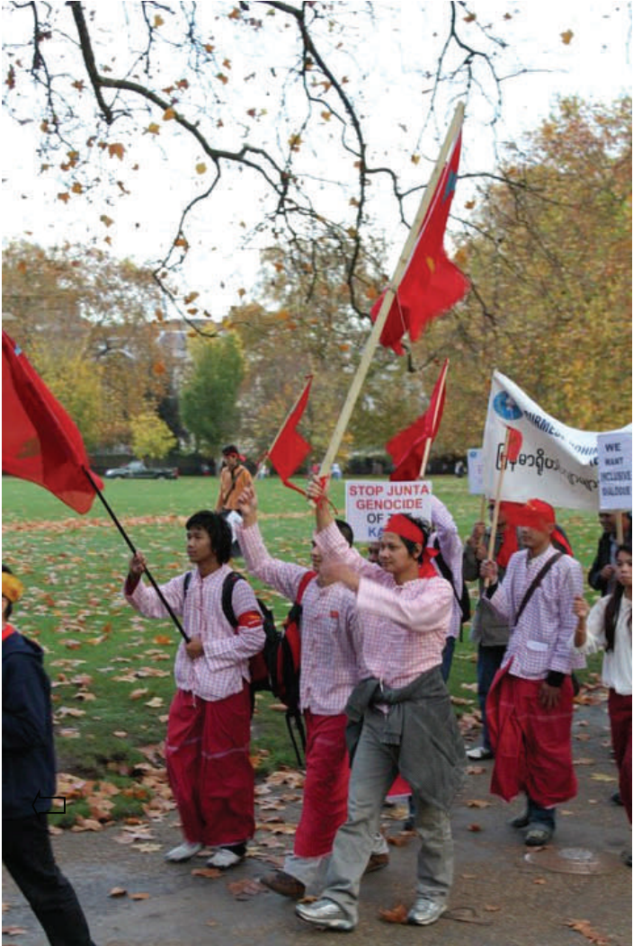
ပိုကောန်မန် မွဲချင်ယူကောတဒ် ပံင်တောဲ ကုဂကောံနာနာတဲ ဇက်ဂြေင်ဒိုင် သွက်ဝံကောံထွဲဆန္ဒ ဒစိုဒစး မာဲအလီ တုအဂီုဟန်။

ပီနုဂ်ပွန် ပွဲအံက်တပ်ပါ ၂၊ ရံ ဂကောံ (၁၃) သိုကို ဂကောံမန် ကောံ ဇရိုတဲ ထံက်ဂလန်လတူ အံင်သာန်သုကီမဟီ စူးကိုဒပ်ဟန်ဒေဒ် အ် ပန်ဟေ်တဒ် ကိုပဒပ်ကင်ပယျိုက် ချပ်ဂွန် ပရေင်ချင်ကွာန် မဒင် သဇိုင် ကုစိုတ်ခါတ်လိက်ကသုက်ပေန်လုံ။ ဇ္ဇိုက်ဇ္ဇောဝ် ညးချင်ကွာန် တဒ် ညံင်ဝံထံက်ပင် ရဲဒေဒ်ပန်ဟေ်တဒ်ရ။