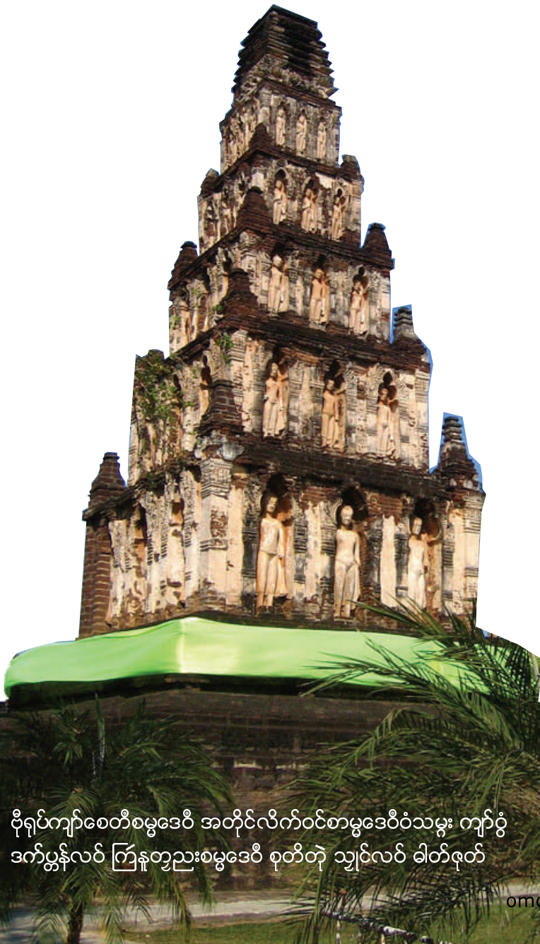
ဝိုရပ်ကျာစေတီစမ္မဒေဝီ အတိုင်လိက်ဝင်စာမ္မဒေဝီဝံသမူး ကျာဝံ ဒက်ပွန်လပ် ကြနုတ္တညးစမ္မဒေဝီ စုတ်တဲ သျှင်လပ် ဓါတ်ဇော်

ဟိုတ်နူဒြဟတ်ပွန်ချင် ဟရိဘုဉ္ဇယျဂိုင်တဲ ကျာဂ် သျှင်တိုန် သိုင်လဝေါညာတ်တဲ ပွဲဗတံဂ် ညးတေအ်ကို ကောန်ပွန် ညးတေအ်တာန်ဩိုင်ကောတ်