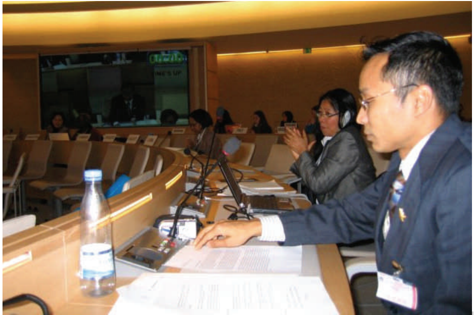
စိုရပ် နာဲစီထပ်မန်တြေ အယောမပ္ပိုန်ထွးဒိုင် ပရူမန် ပ္ဍဲသဘင်ကောံရေဂီကုလသမဂ္ဂ။

“တိတ်ညိုင်မန်ဂ် ညိုင်ပေင်ကိုသံယံဇာတတို တွအပိုဟ်ဗာန်ဗာ ခြေတ်ကောတ်သ္မုတ်ခါတ် န့ညိုင်မန်တို သ္မိတ်ညိုင်ဝတ်ဒိုတ် ဗွဲတေင် ညိုင်သေံ ဂ္ၚိုင်ကိုစီလီယာန်တို ဩန်မကလိဝံ