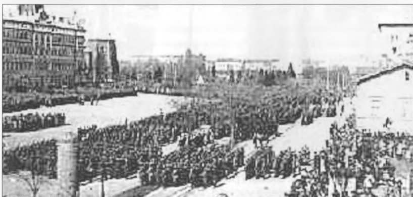
Парад белых в Выборге в апреле 1918 года. Первыми через город торжественным маршем прошли герои Рауту и Ахвола Valkoisten voittomarsi Viipurissa. Huhtikuu 1918