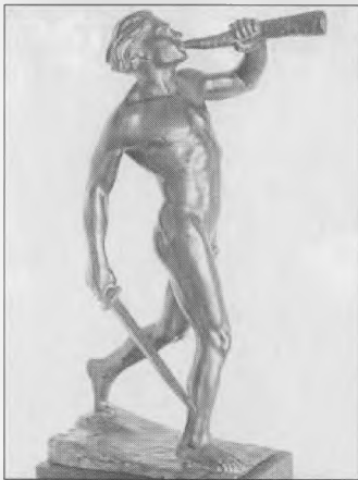
«Освобожденная Карелия». Скульптор Юрьё Лийпола Yrjö Liipolan Vapautettu Karjala