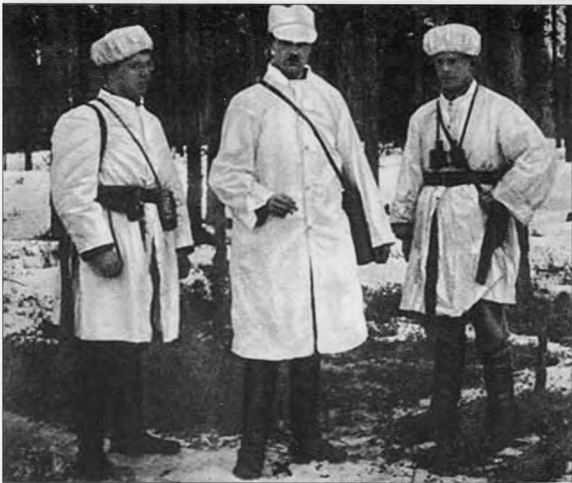
Г. Эльвенгрэн (в центре) на боевых позициях. 1918 г. Vapaussodan etulinjassa vuonna 1918 (Yrjö Elfvengren on keskuksella).