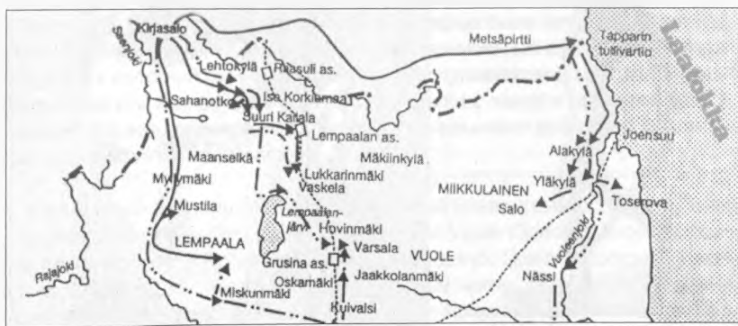
Схема военных действий в Северной Ингерманландии летом – осенью 1919 года (P. Nevalainen. Rautaa Inkerin rajoilla. SHS, Helsinki. 1996)