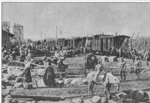
Лагерь белых на станции Кивиниеми (современное Лосево) Valkoisten sotaleiri Kiviniemin rautatieasemalla (nyk. ven. Losevo)