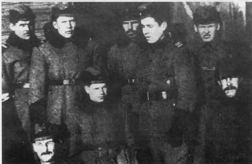
Бойцы Северо-Ингерманландского полка Pohjois-Inkerin sotilaat