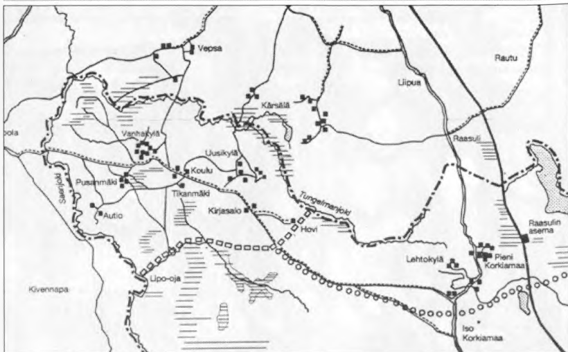
Район Кирьясало – Раасули с линией фронта армии Эльвенгрена (P. Nevalainen. Rautaa Inkerin rajoilla. SHS, Helsinki. 1996)