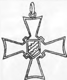
Северно-Ингерманландский орден Крест Белой Стены Pohjos-Inkerin Valkoisen Muurin Risti