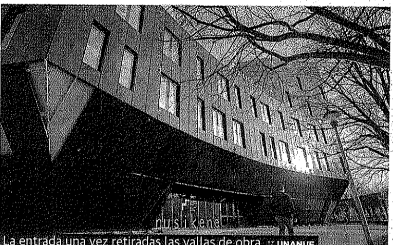
La entrada una vez retiradas las vallas de obra. :: UNANUE