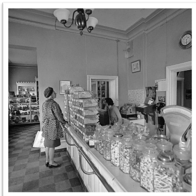
Foto Lennart af Petersen, fotonummer F 97607, Stockholms stadsmuseum