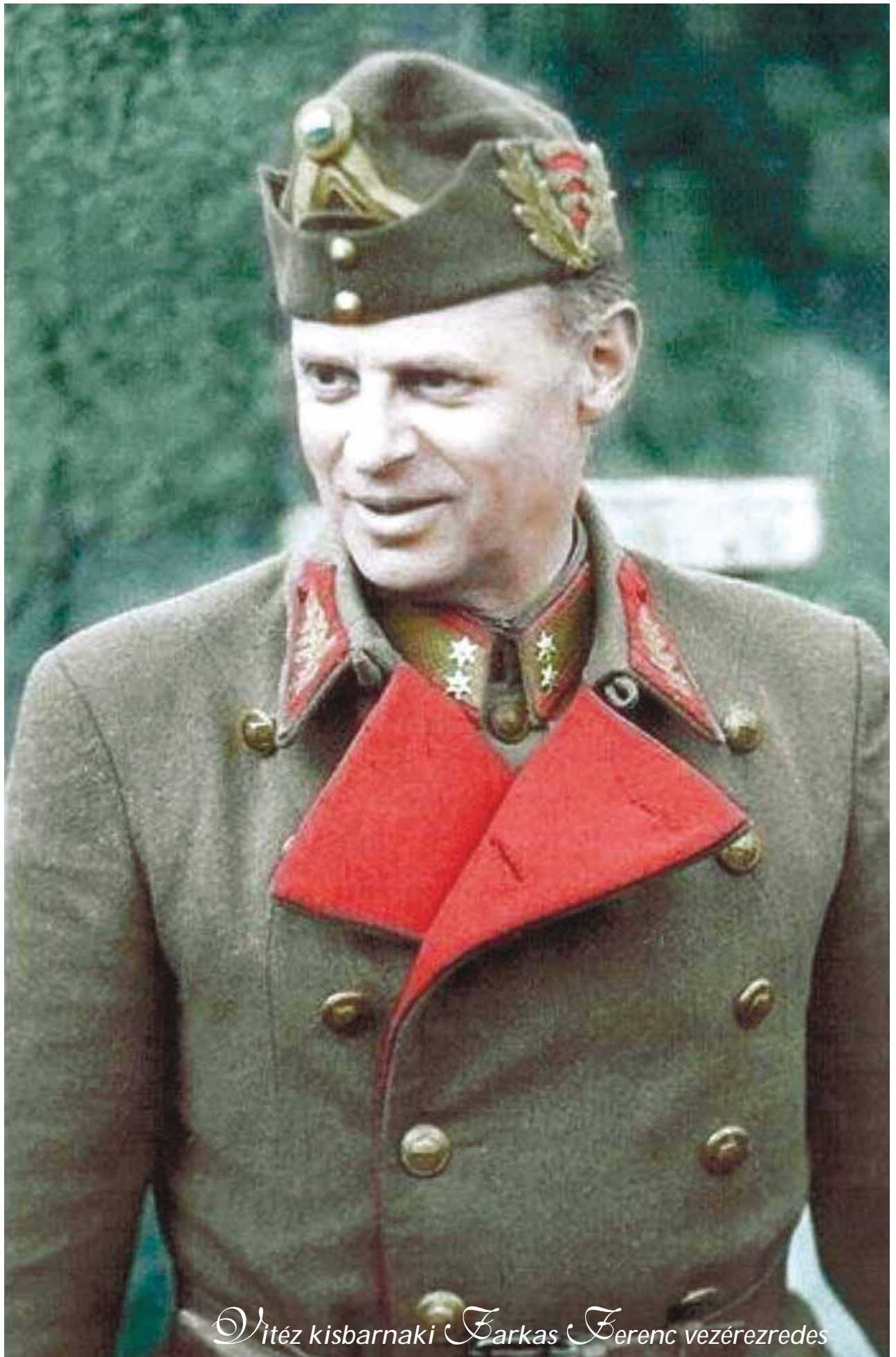
Vitéz kisbarnaki Barkas Ferenc vezérezredes