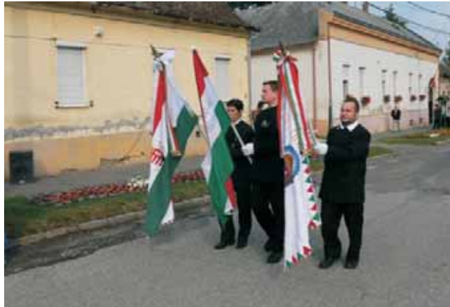
A zászlók bevonulása

... De hirdessük gúzsba kötött kézzel Sebes ajkkal, lázadó vérrrel Idézve menny, pokol hatalmait Hogy béke nincs, hogy béke nincsen itt. Kezüink bár nem pihen a kardvason A szíveinkben nem lesz nyugalom.