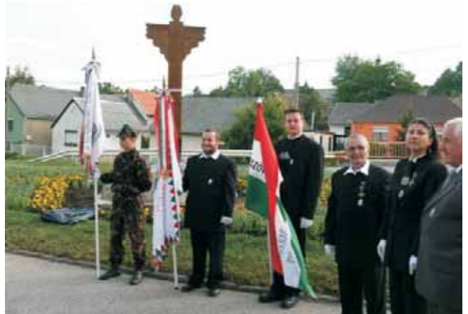
Díszőrség a Trianon keresztnél

kórus előadásában csángó népdalokat hallgathattunk. A megemlékezés koszorúzással folytatódott. Koszorút helyezt el az emlékműnél a Történelmi Vitézi Rend, a Hosszúhetényi Önkormányzat, a Pécs-Baranyai 56-os Szövetség, az 1848-'56-os alapokon nyugvó Baranya megyei Nemzetőrség, a Komlói Erdélyi Kör, Vasasi Szent Borbála Egyesület, valamint az ünnepségen résztvevő személyek.