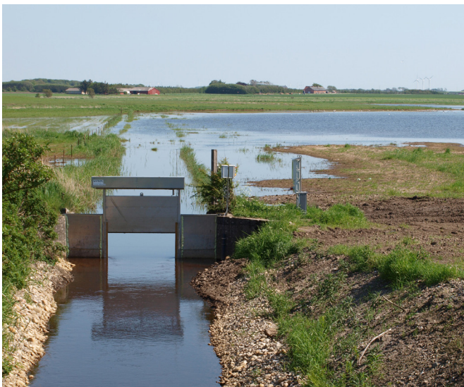
Sluse med højvandslukke ved udløbet fra Grynderup Sø

I forbindelse med det nye vådområdeprojekt er alle pumper og dræn indenfor projektområdet sat ud af drift, samtidig med at alt vand fra oplandet ledes til søen. Resultatet er en sø med en vandstand ca. 1 m over Limfjordens daglige vande. I forbindelse med projektet er der gennemført en jordfordeling, der har omfattet ca. 70 ejendomme og 620 ha.