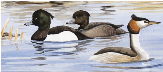
Troldænder og toppet lappedykker (akvarel: Peter H. Kristensen)

I yngletiden kan der blandt andet ses flere arter lappedykkere, rørhøg, vibe, rødben, klyde, dobbeltbekkasin samt forskellige småfugle, der er knyttet til de fugtige områder rundt om søen, f.eks. rørspurv, engpiber og gul vipstjert.