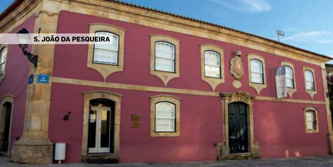
S. JOÃO DA PESQUEIRA