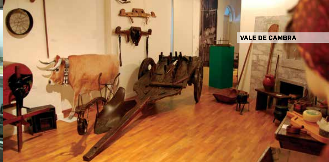
VALE DE CAMBRA

Largo Dr. Balbino Rego 5160-241 Torre de Moncorvo GPS: 41° 10' 23.78" N 7° 03' 11.73" W tel.: 279 252 724 e-mail: museu-ferro@hotmail.com site: www.mfrm-cdoc.blogspot.pt/cardapio.pt