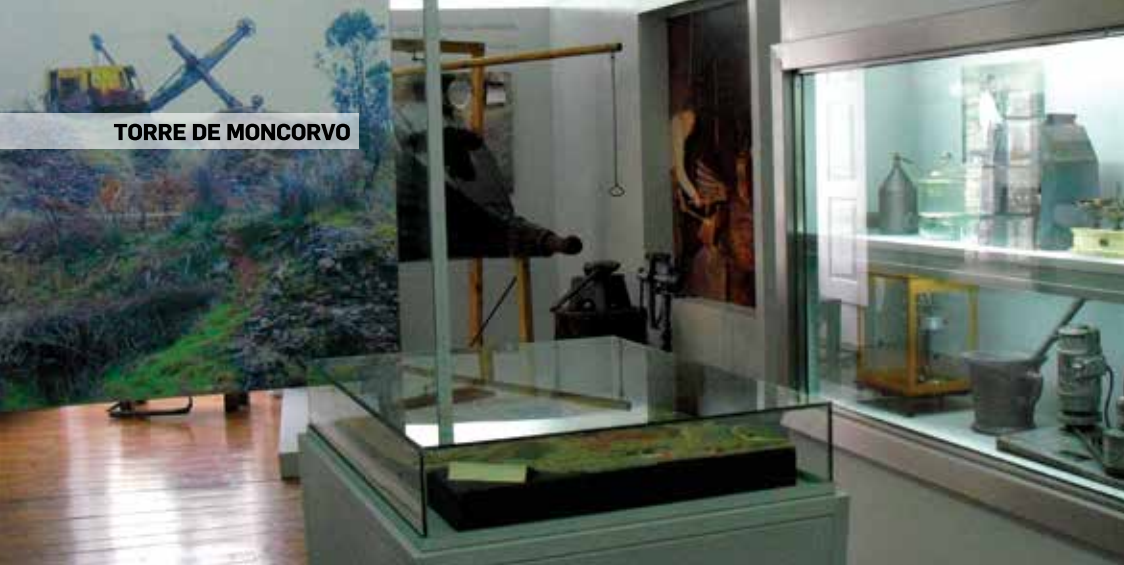
TORRE DE MONCORVO