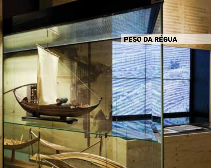
PESO DA RÉGUA