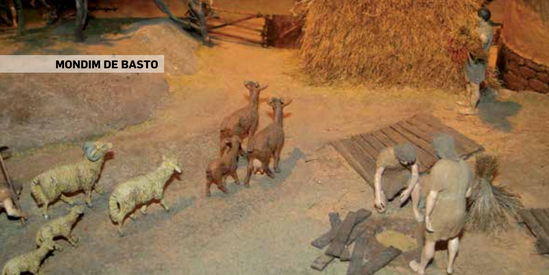
MONDIM DE BASTO