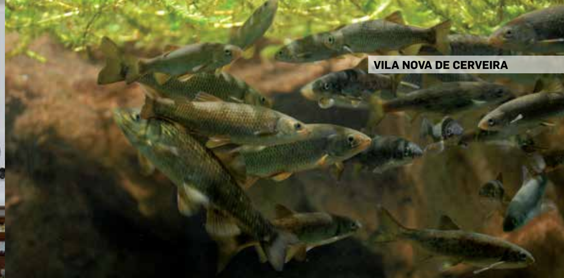
VILA NOVA DE CERVEIRA

Largo Dr. Alexandre de Matos 5360-325 Vila Flor GPS: 41° 18' 25" N 7° 9' 11" W tel.: 278 512 373 e-mail: museu.berta.cabral@mail.telepac.pt site: www.cm-vilafior.pt