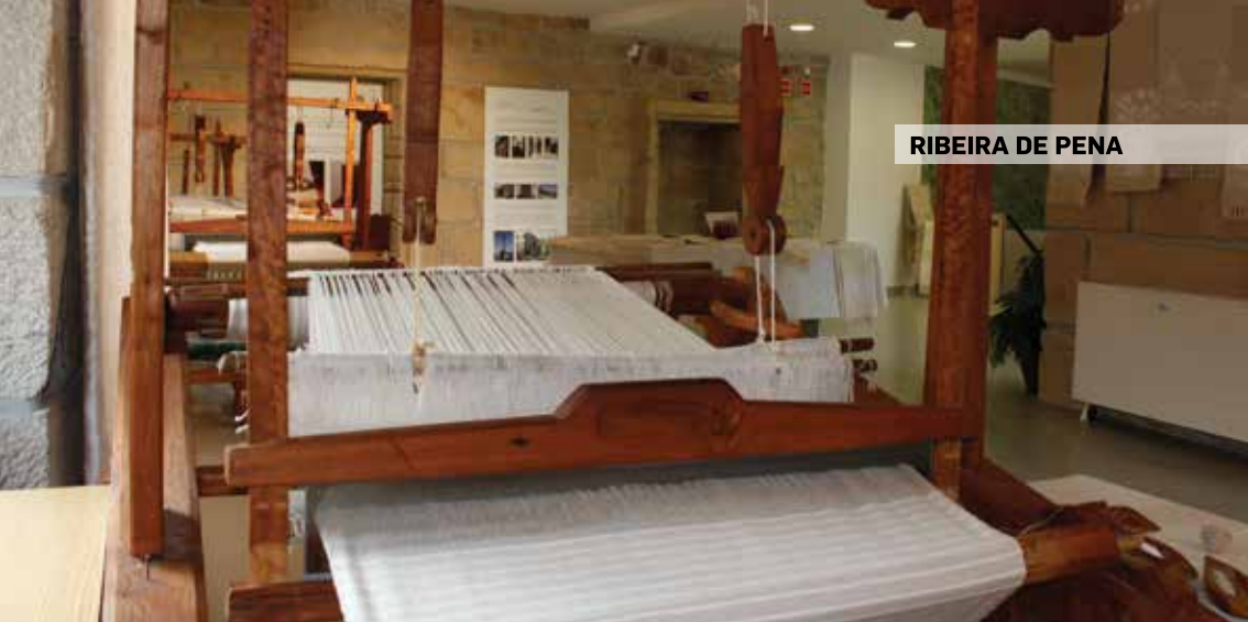
RIBEIRA DE PENNA

Rua Dr. Amadeu Sargaço 4660-238 Resende GPS: 41° 06' 15" N 7° 57' 33" W tel.: 254 877 200 e-mail: museu@cm-resende.pt site: www.cm-resende.pt