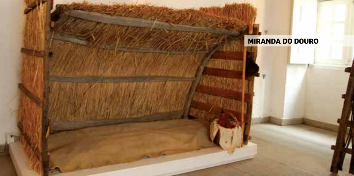
MIRANDA DO DOURO

Rua do Carvalho- Centro Histórico 4960-536 Melgaço GPS: 42°6'52.18" N 8°15'36.90" W tel.: 251 401 575 e-mail: museudecinema@cm-melgaco.pt site: www.cm-melgaco.pt