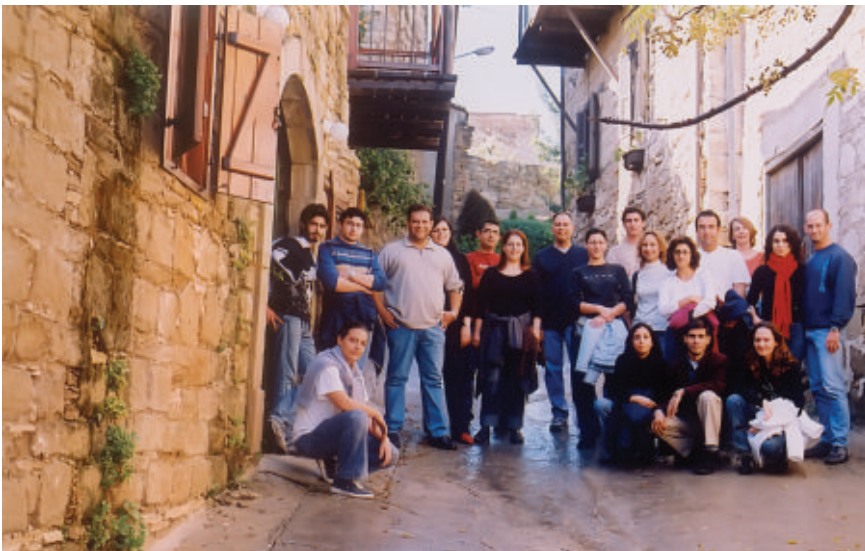
Το τμήμα Ακριτών στην πρώτη του διήμερη εκδρομή στην Τόχνη το Νοέμβριο του 2005

Στη Γαλλία εκδράμουν 36 Ακρίτες όπου με βάση τον ξενώνα του Σεπόι πέρασαν υπέροχα! Στο Παρίσι η ιαχή «όλο το Παρίσι είναι μπλε!» δονεί την ατμόσφαιρα.