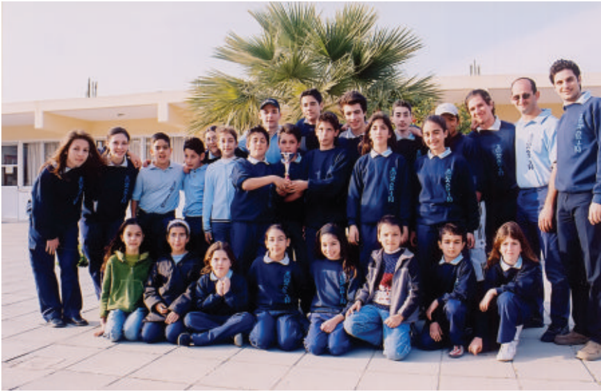
Οι πρώτοι Ακρίτες της Παλουριώτισσας το 2004