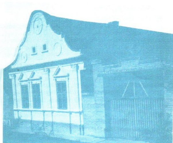
Fasada jedne Brestovačke kuće