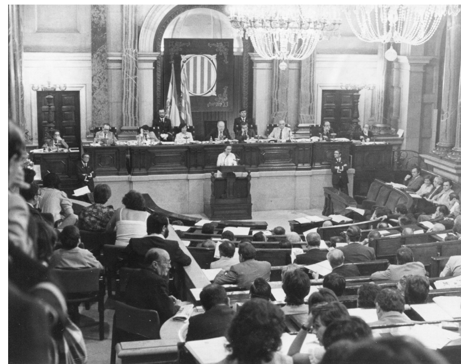
Parlament de Catalunya