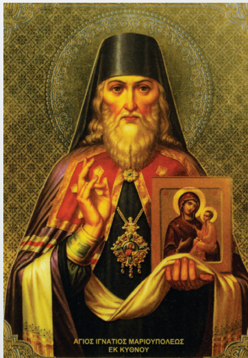
ΆΓΙΟΣ ΙΓΝΑΤΙΟΣ ΜΑΡΙΟΥΠΟΛΕΩΣ ΕΚ ΚΥΘΝΟΥ

Το 1769 ο Δεσπότης καθίσταται διάδοχος εν Θεώ του εκδημήσαντος επισκόπου