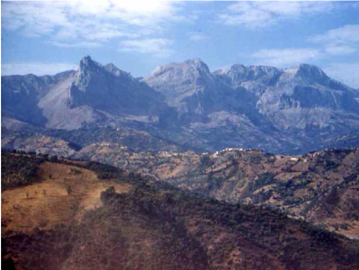
Les Aiguilles de la Main du Juif, l'Azerou Ou Gougane (2.158 m), l'Akouker (2.184 m) et le Ras Timedouine.