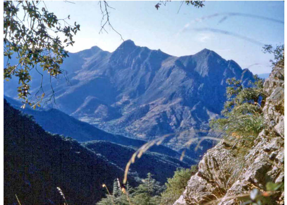
Le sommet du Djurjura : Tamgout de Lalla Kredidja (2 308 m) depuis les Aït Ouabane

Sainte-Monique. Ils forment une cinquantaine de familles, soit une population d'à peu près trois cent cinquante personnes. J'ai appris que les enfants de ces indigènes chrétiens détestent les Arabes et refusent de parler une autre langue que le français.