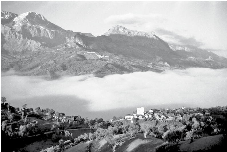
Le Ras Timedouine (2 305 m) et le Dj. Tiassassin (2 102 m).

Je rentre dans ma chambre. Elle se trouve au rez-de-chaussée, non loin de la table autour de laquelle causent les gais convives. Longtemps le cliquetis des verres et le bruit des discours me tiennent éveillé. Tout se calme cependant aux environs de onze heures, et je m'endors bientôt, bercé par le murmure monotone et continu de la fontaine voisine, symbole du temps qui, par son action incessante, transforme les éléments les plus impurs et en fait sortir des merveilles 224 .