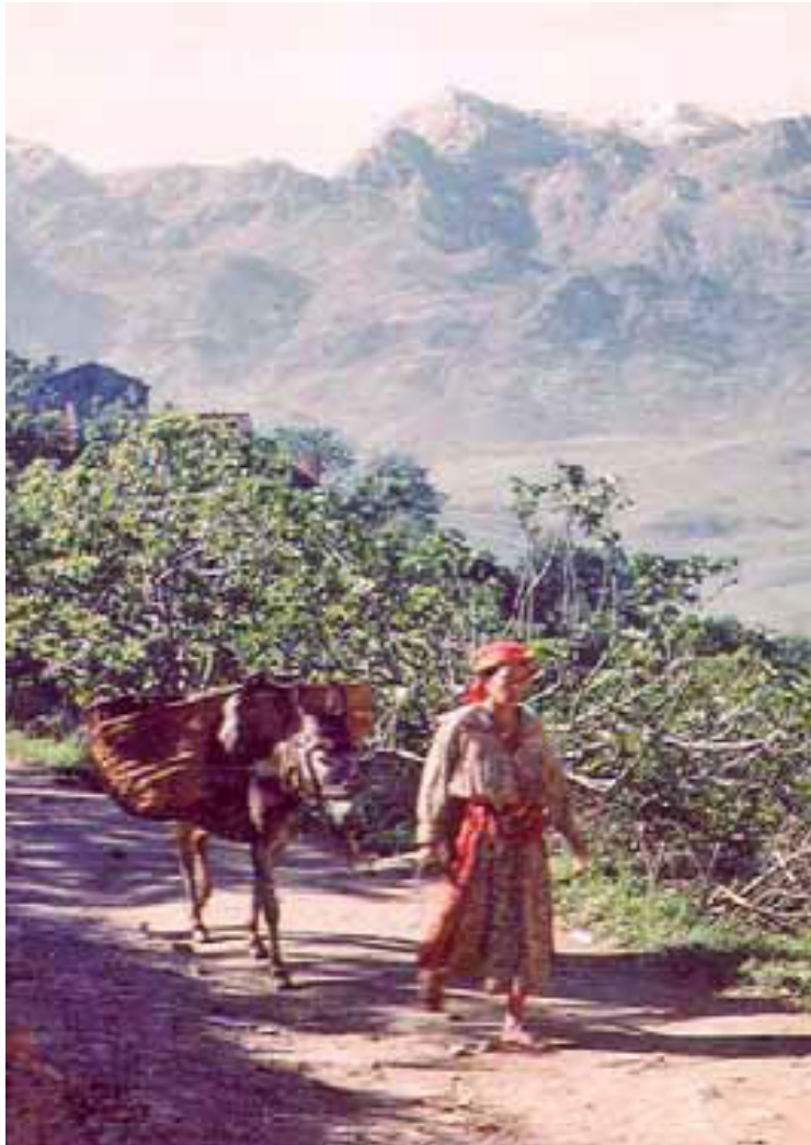
Jeune femme kabyle et son âne à Taguemount el Djedid.