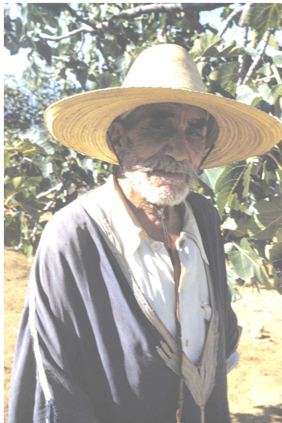
Un sage de la tribu des Idjer

études approfondies ; j'espère qu'elles seront bientôt entreprises. Mais si l'on veut vraiment parvenir à la vérité, il faut absolument renoncer aux partis pris, observer même ce qui peut déplaire, regarder en face les choses et les hommes : en Kabylie il faut voir le Kabyle, et le Kabyle tel qu'il est.