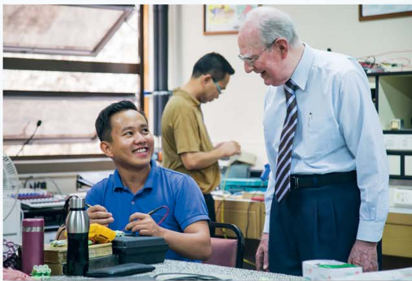
Мы по-прежнему служим в филиале в Кесон-Сити

Иногда под давлением католических священников местные власти не давали нам разрешения на проведение конгрессов. Если конгресс проходил неподалеку от церкви, священники начинали трезвонить в церковные колокола каждый раз, когда на сцену выходил докладчик. И все же мы продолжали учить людей истине, и сейчас на Филиппинах много служителей Иеговы.