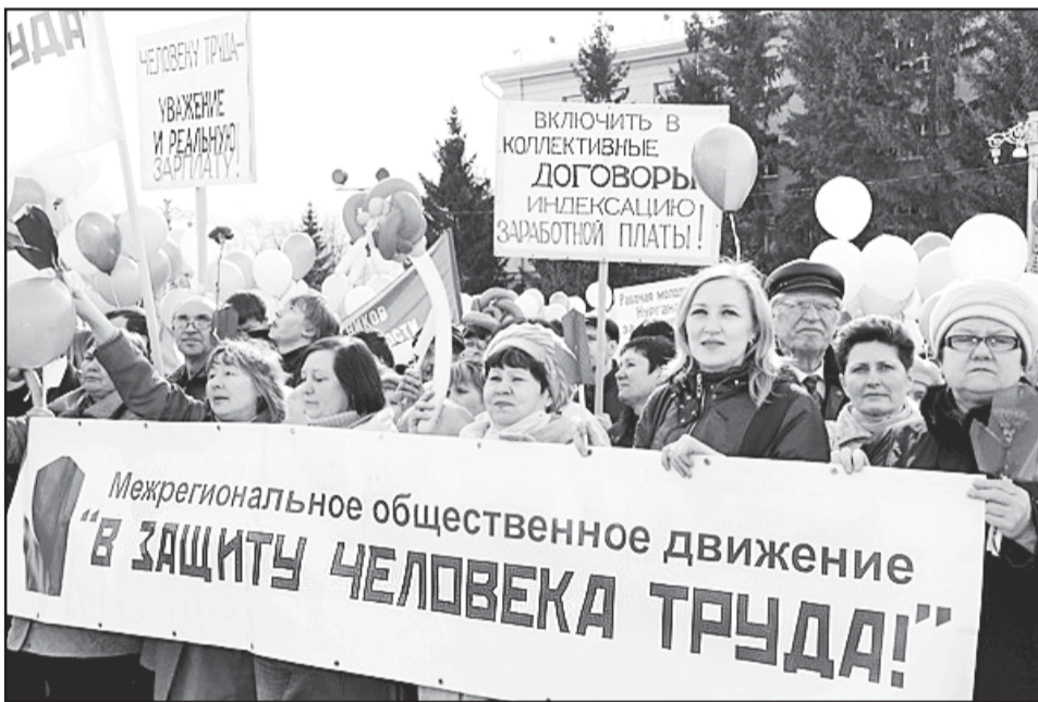
Первомай в Кургане.

О том, как проходили мероприятия в отдельных регионах, "Солидарности" сообщили представители информационных служб территориальных профобъединений.