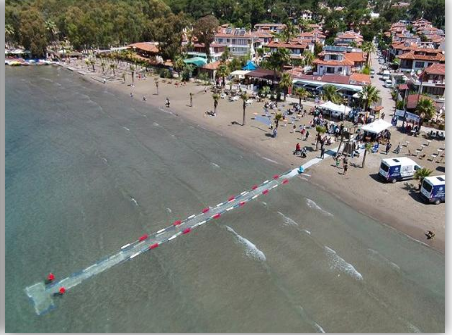
Plajdan rampa yardımı ile denize giriş imkanı