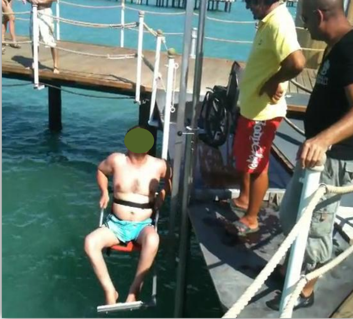
İskeleden denize asansörle iniş imkanı