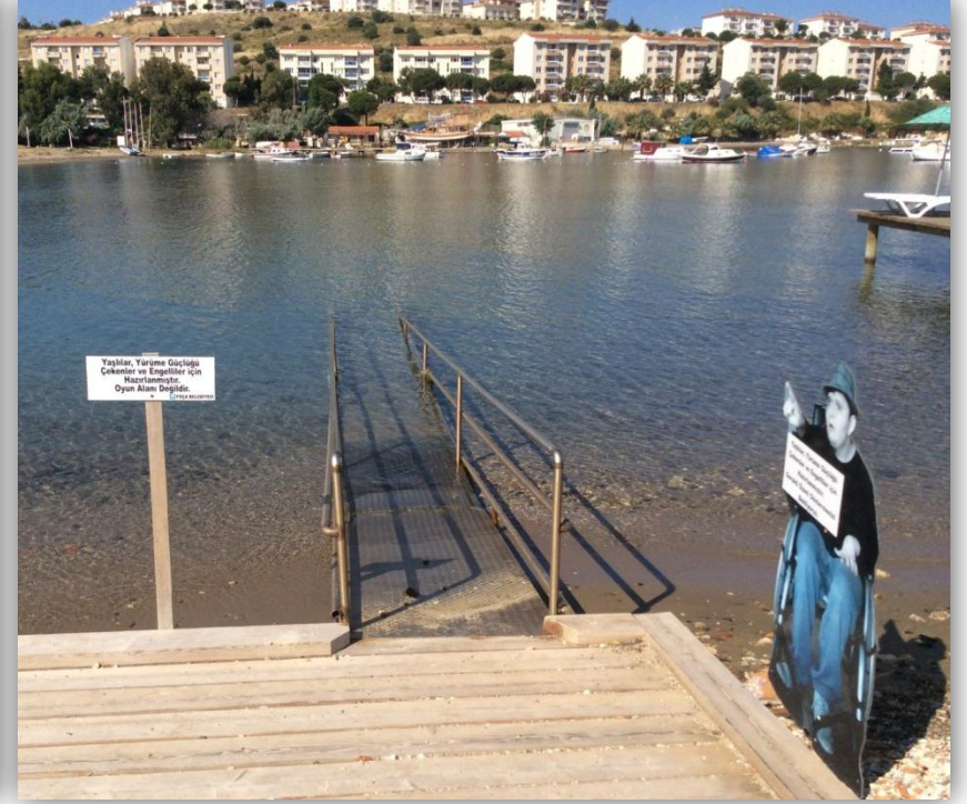
Plajdan rampa yardımı ile denize giriş imkanı