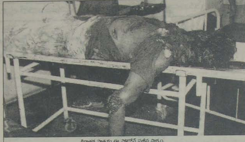
కీరాతక హత్యకు ఈ ఫోటోనే సజీవ సాక్ష్యం.