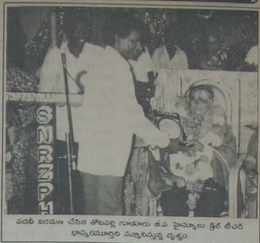
వరదీ బరమణుల చేసిన తోటవల్లి గూడూరు ఉప హైస్కూలు త్రిక లేవర భాస్కరయ్యలొద్ద సాంస్కృతిక ప్రదర్శన

లోక్ సభ 5వ పేజీ కొరవ కంటే 1556, 1762 ఓట్లు అధికంగా రాజకీయంపై తెచ్చుకున్నారు. నెలనూరులో 4,653 ఓట్లు, పోస్టులో బ్యాలెట్లో 376 ఓట్లు అధికంగా చూడమనే పనబాకలట్టి పరిశీలించి దొంగరిగారు. అసెంబ్లీ స్పీకర్ అయిన తెలుగుకేంకల పట్టిన, పార్లమెంటుకు పనబాక లక్షక 199 ఓట్లు మొదలు ప్రచారం జరిగినా ఎన్నికల ఫలితాలు వెలువడతే ఇది వట్టి మాటలనే మిగిలిపోయింది. రెండుసార్లు పనబాక ఎమ్మెల్యే పోటీ చేసినప్పుడు ఆమె ప్రత్యర్థులుగా మార్కెట్ పార్టీకి చెందిన భానురాజు, స్వర్ణలక్ష్మణులు వున్నారు. ఈసారి తెలుగుకేంకల పట్టిన అభ్యర్థి పోటీకి దిగడం ఆమె ప్రచారం పెద్దగా చెప్పకోక పోవడం తనకు ధీక లేదన్న ధీమాతో లక్షక వందనలో వెలువడతే పోటీకి క్షుణ్ణంకొంటారు. కర్నూరు కోటింగ్ పూర్తయిన కొద్దు, గూడూరు నియోజక వర్గాల్లో తనకు మొత్తం రాజీవం తెలుసుకొన్న మరుగునట్టి లక్షక ముఖం కల కచ్చియింది. ఏ ఎమ్మెల్యేలుగా పోటీయగా వివిధ అభివృద్ధి పనులు చేసినా ఆమె పట్టిన రోజు (అక్టోబరు 6)కే పరచాయాన్ని ఓట్లకు కానుకగా ఇచ్చడం చాదాకరమే అయినా ప్రభాకరెక్క తోధార్థం కదా! వ్యాయామ ఉపాధ్యాయుని పదవీ విరమణ తొలవ్విగూడూరు జిల్లా పరిషత్ హైస్కూల్లో వ్యాయామ ఉపాధ్యాయుని పనిచేస్తుండే భాగ్యరమణ్ణి 13వ పదవీ