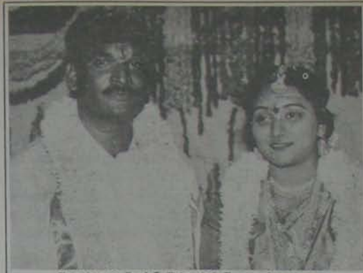
నెల్లూరు రాజు మాపానిచోరం కుమార్తె శిల్ప ముఖ్యమంత్రి చంద్రబాబునాయుడు పీఠ యోగంనాయుడు నివాసం ఆగస్టు 29 తేదీ తెలుగుదేశం అధికారం.

కావలి నియోజక వర్గంలో తెలుగుదేశం పార్టీ గెలుపునంది స్పష్టంగా ప్రకటించడమే కాదు - మెటారిటీ సైతం భారీగా