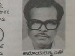
అమాయకత్వంతో అల్లరిపెట్టినాడు కుర్చీలో నుంచి లేచి, గౌడ్ మోద పేద యే ముకున్నాడట అప్పటికీ - చిరదూరం ఆరణ అం పేజీలో

అధించింది అని లక్ష డ్రయ్య ఎగతాళి చేశాడు. మూలల మధ్యలో పుస్తకం లక్ష డ్రయ్య