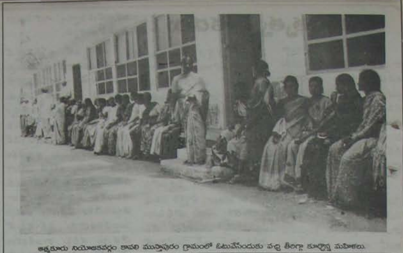
ఉత్తర్రూరు నియోజకవర్గం కాసు మున్సిపల్ కార్యాలయంలో జిల్లావేసేందుకు వచ్చి తిరిగి కూర్చున్న మహిళలు.